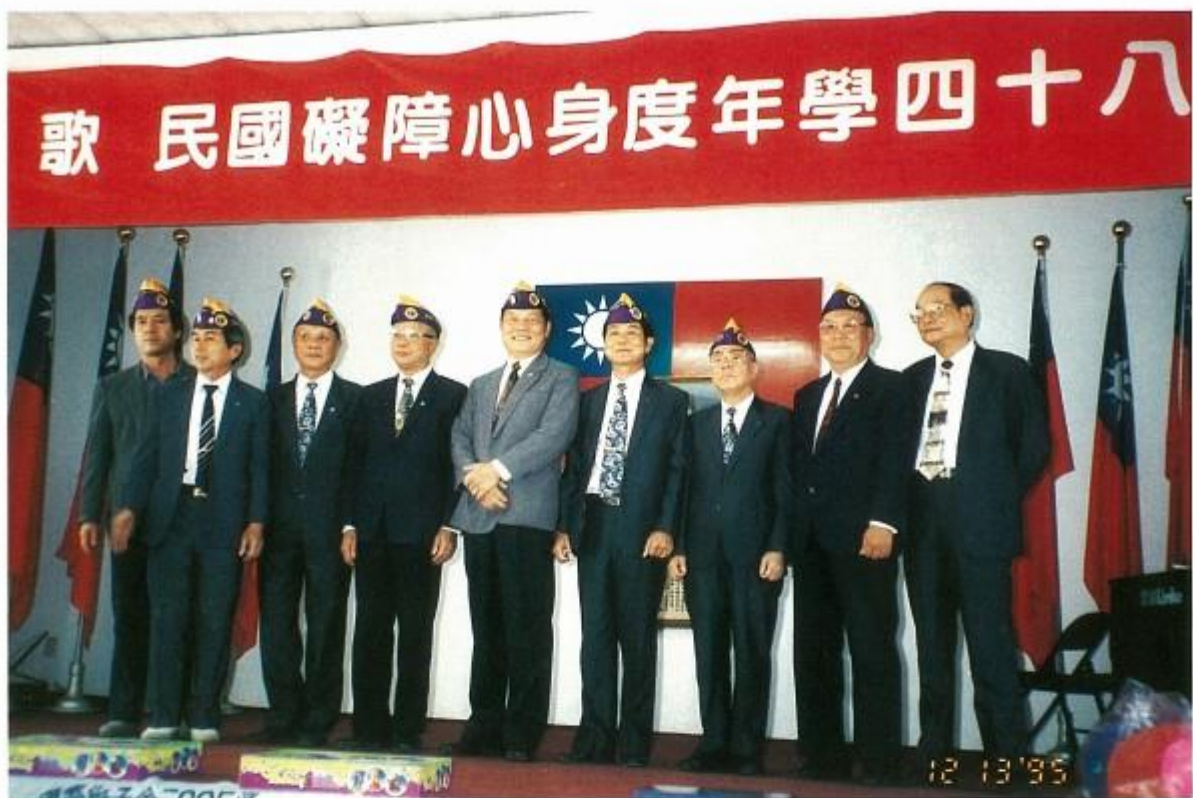
舉辦身心障礙國民歌唱比賽現場獅友合影