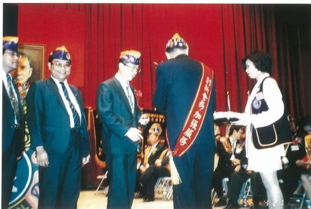
方監督贈送本會獅友捐贈LCIF基金紀念品