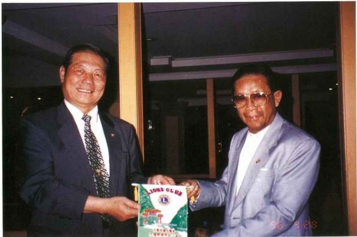
訪問泰國國際獅子會前總會長巴叻贈送本會紀念旗