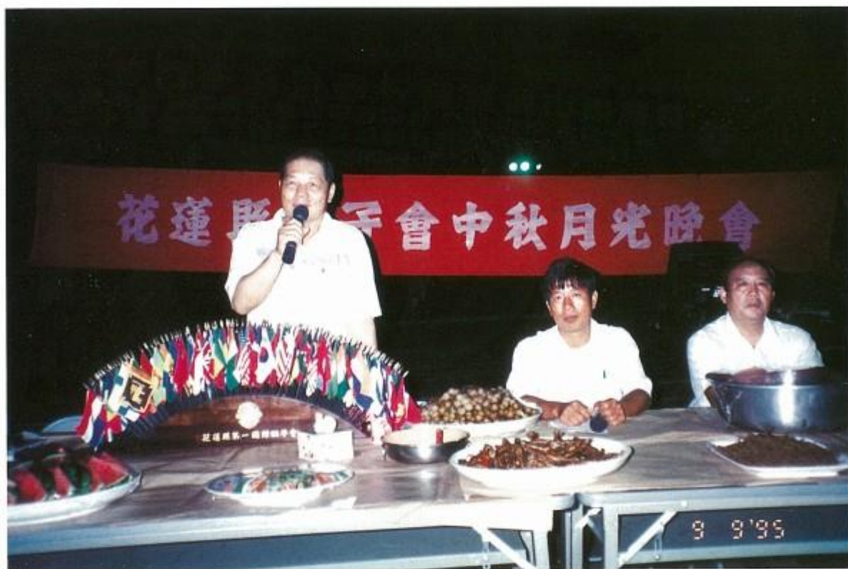
舉行中秋月光晚會，並頒發優秀子女升學獎金