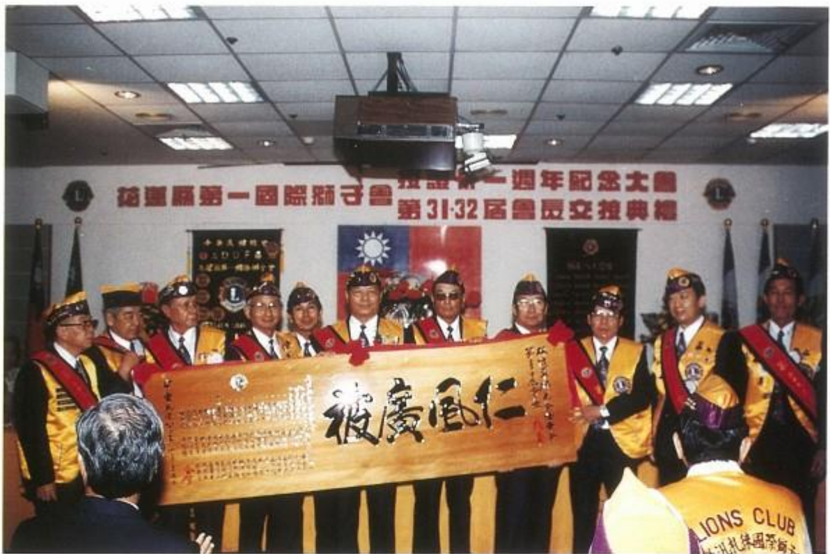
接任第32屆會長，全體獅兄贈送匾額祝賀