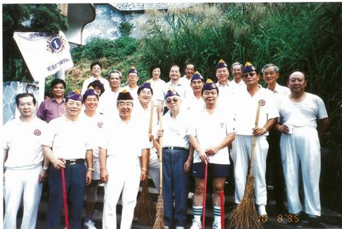
響應世界獅友服務日，全體獅友清掃獅子公園三處