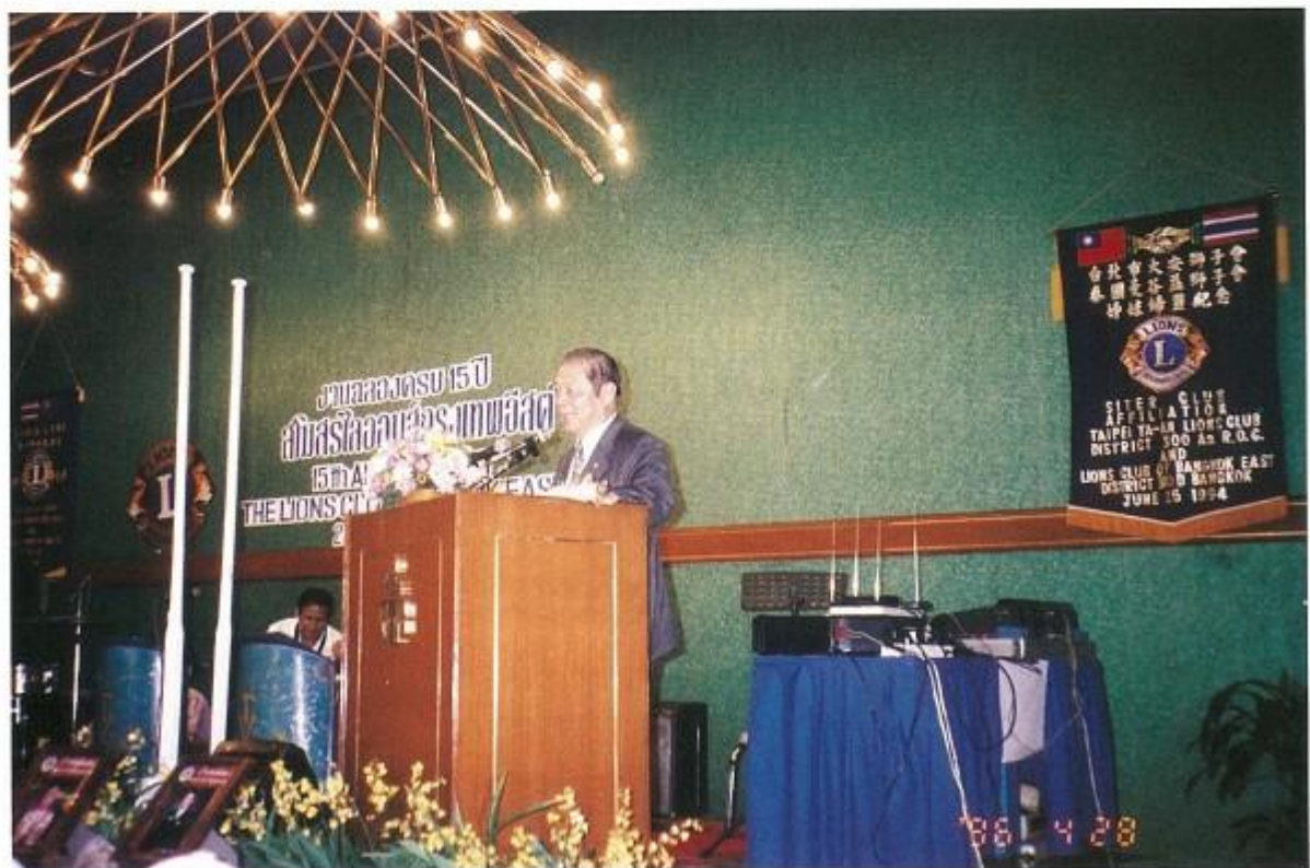
組團參加姊妹會泰國曼谷益會授證15週年典禮會長致祝賀詞