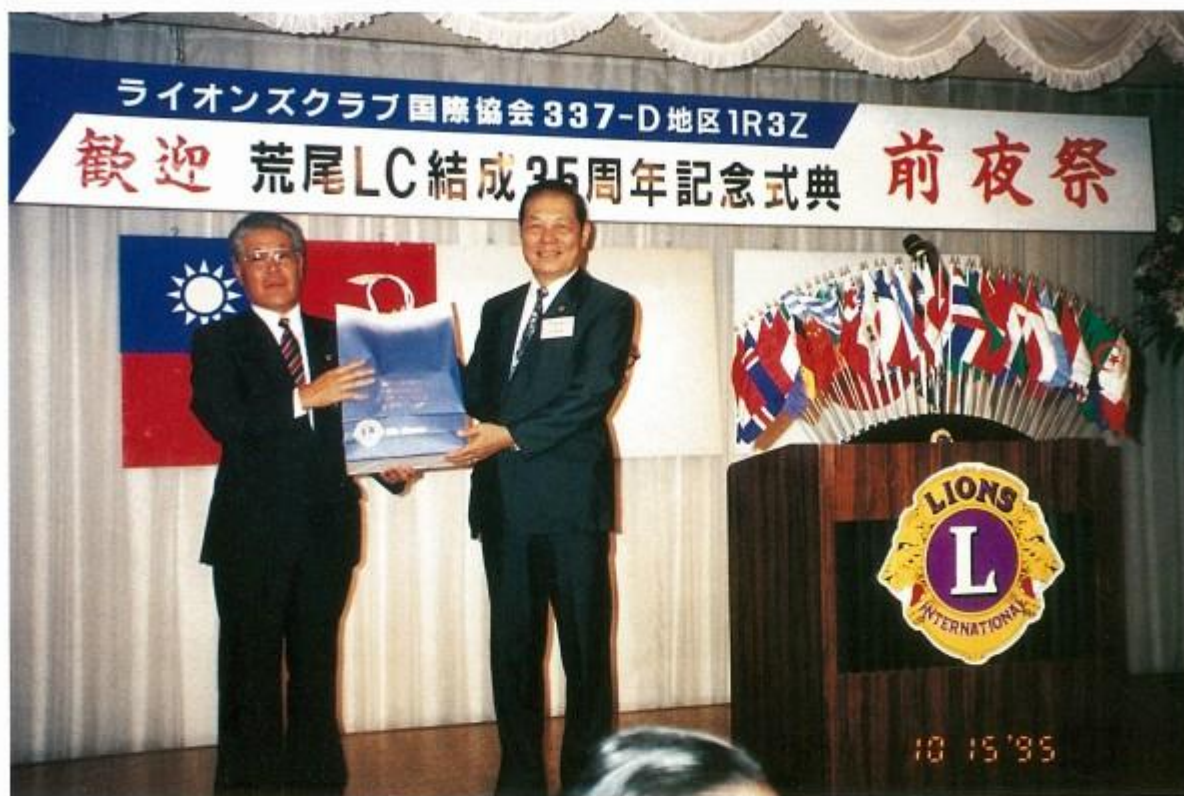
組團參加姊妹會日本荒尾會授證典禮，會長贈送紀念品