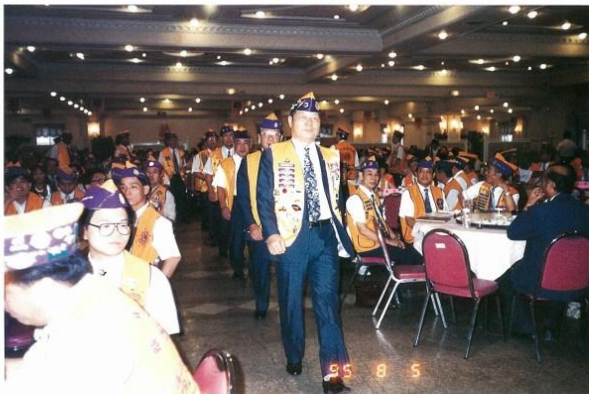
組團參加台中港兄弟會授證典禮步入會場