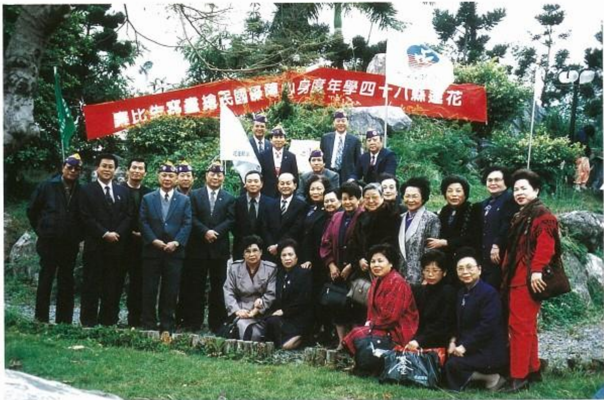
與王縣長等人合影留念