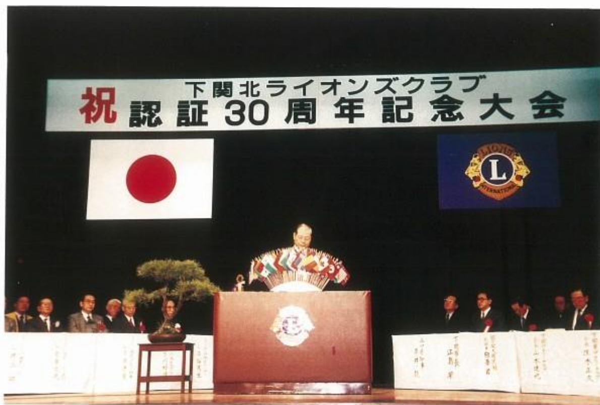
下關北會授證典禮中，會長致祝賀詞