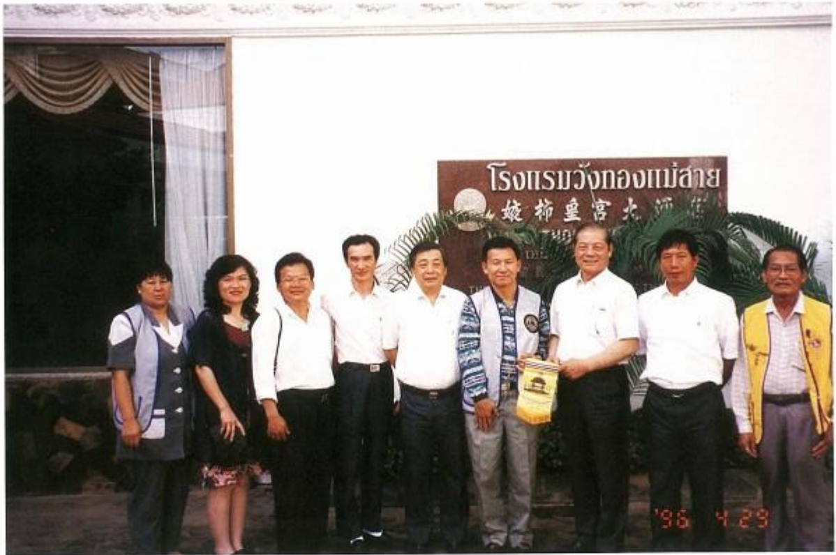
訪問泰緬交界處坡柿獅子會趙會長合影留念