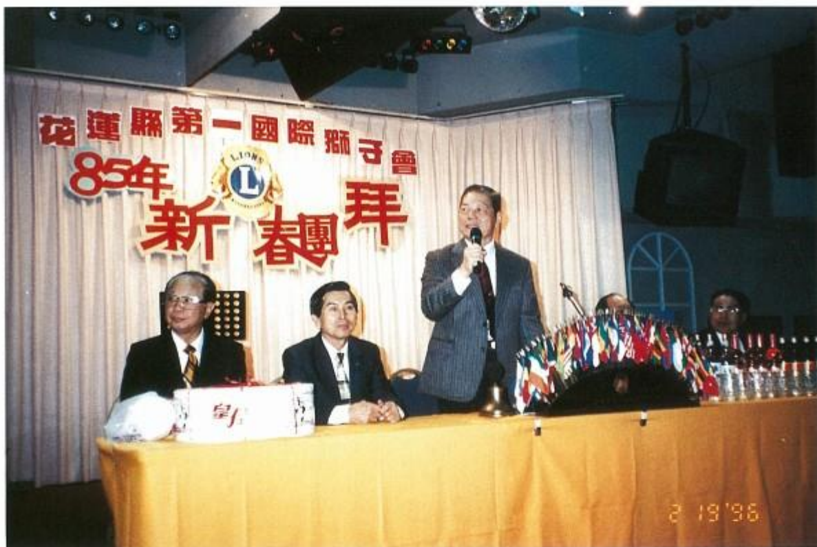
新春團拜會長向大家拜年