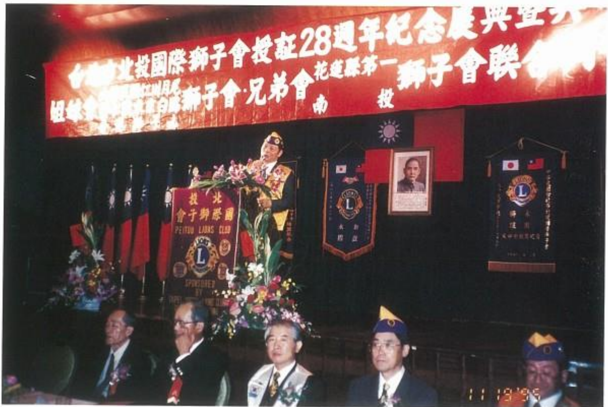
組團參加兄弟會北投會授證典禮，致祝賀詞