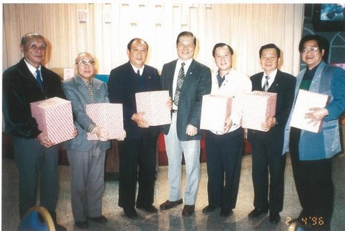
會長贈送績優獅兄合影