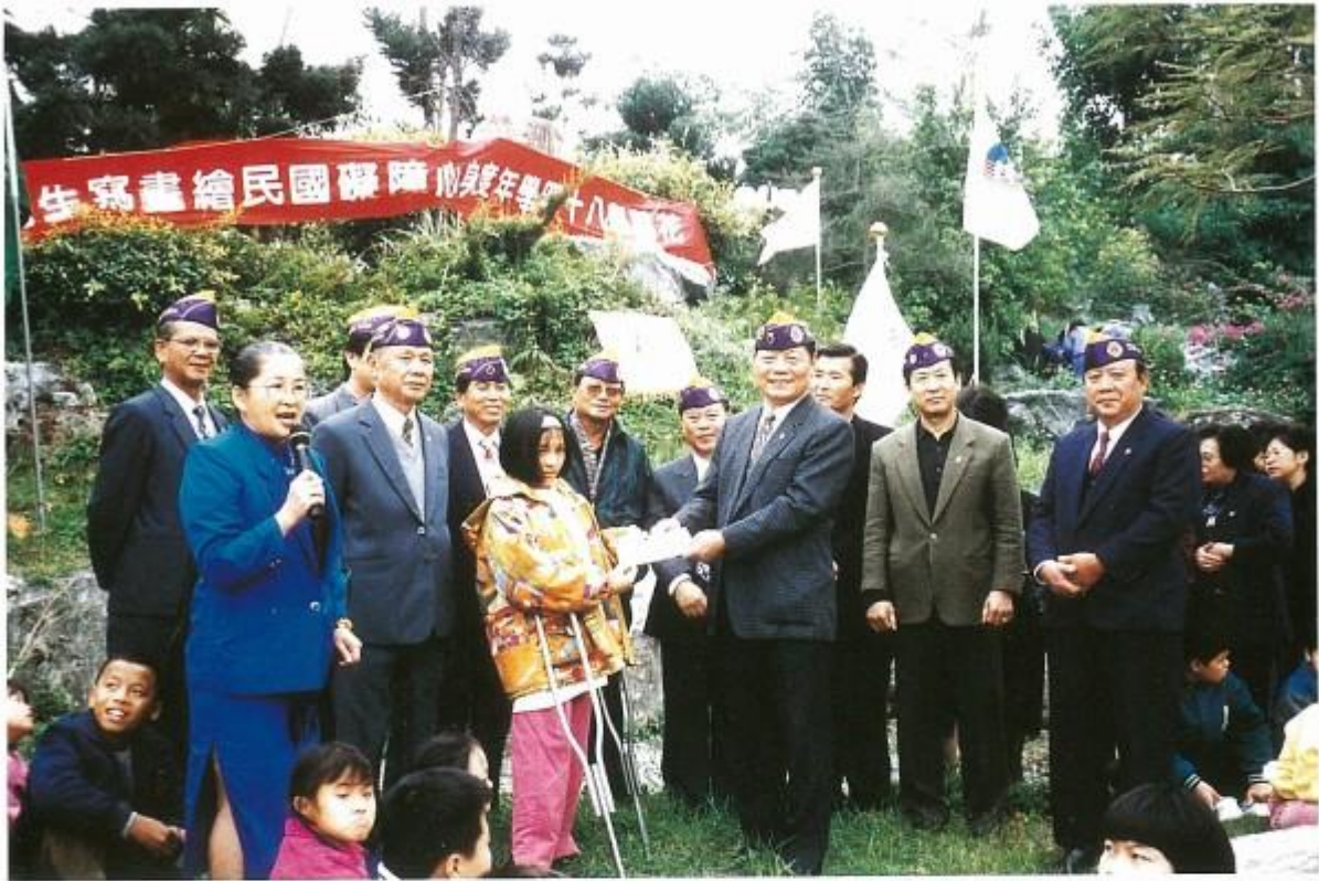
舉辦殘障兒童寫生比賽贈送社會服務金