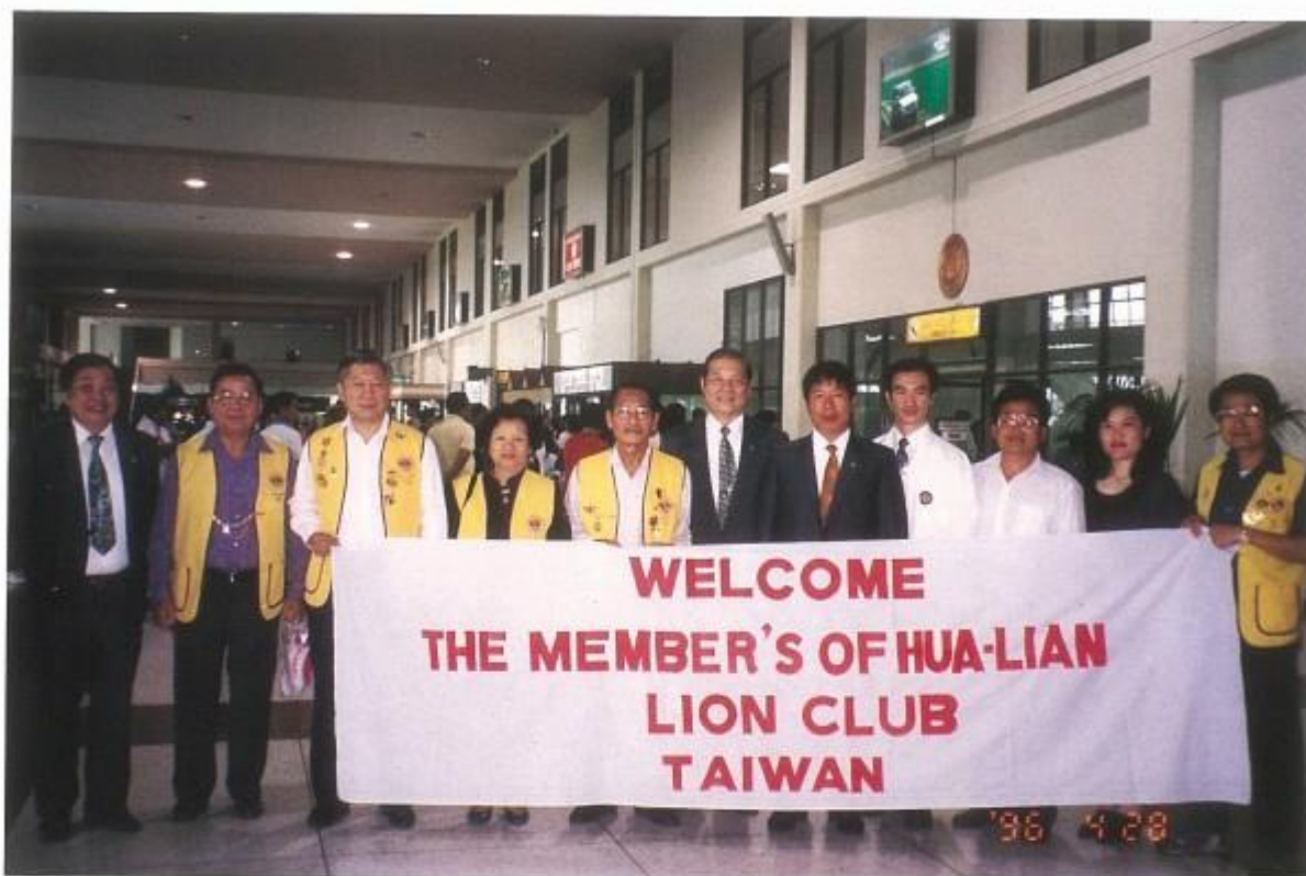
訪問姊妹會泰國清萊會，該會獅友在清萊機場迎接