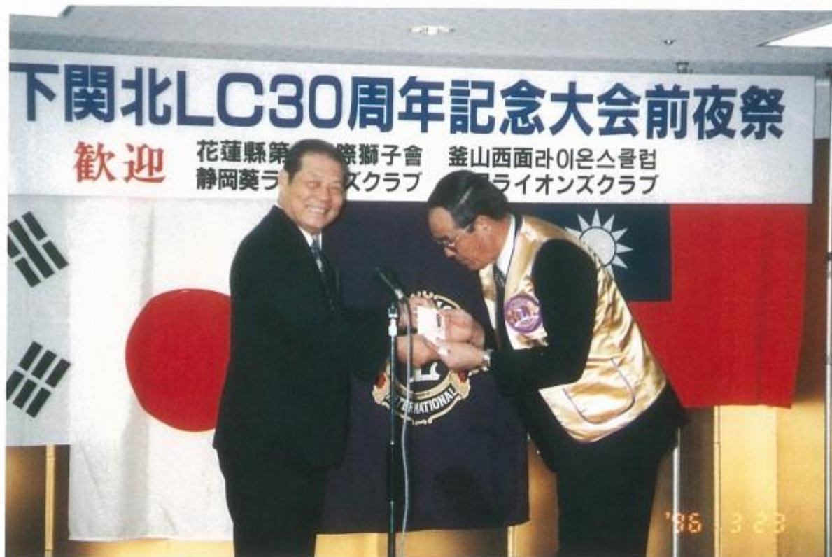
姊妹會日本下關北會授證典禮前一夜，會長參加歡迎會贈送社會服務金