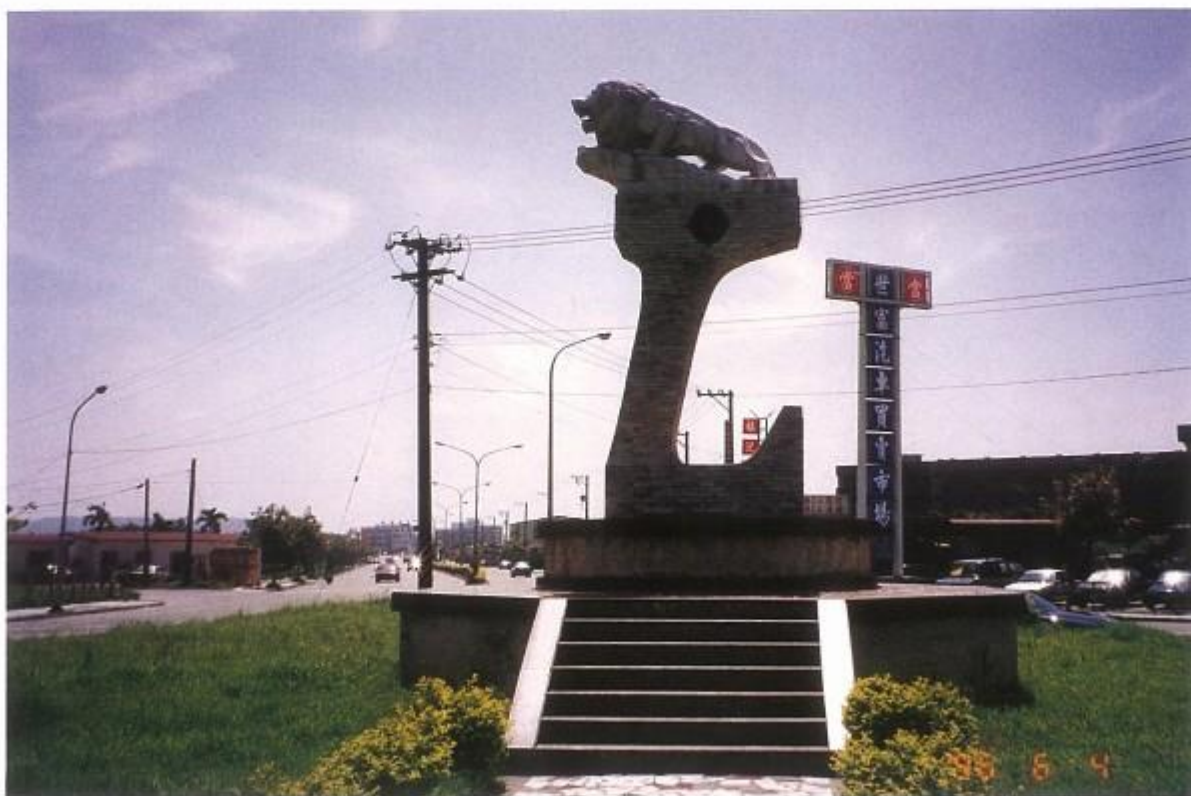
夕陽下，位於吉安一號道路之本會獅子公園