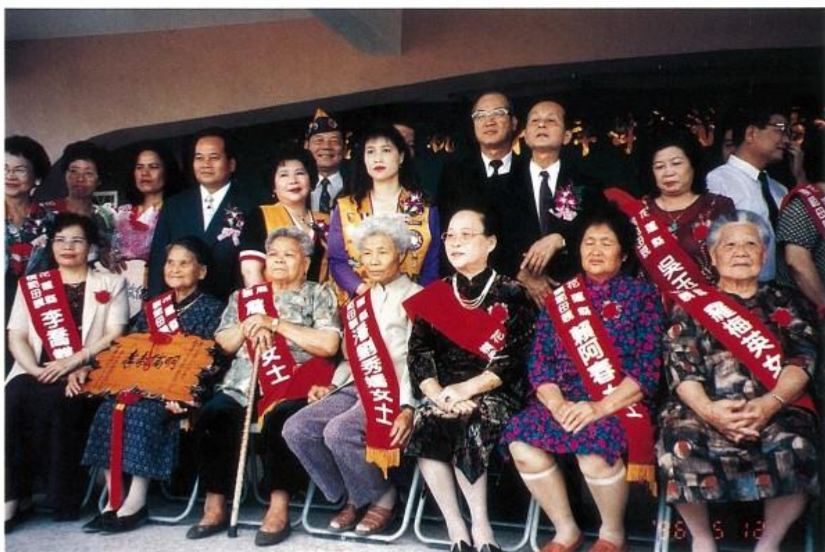
王縣長、吳監察委員與模範母親合影