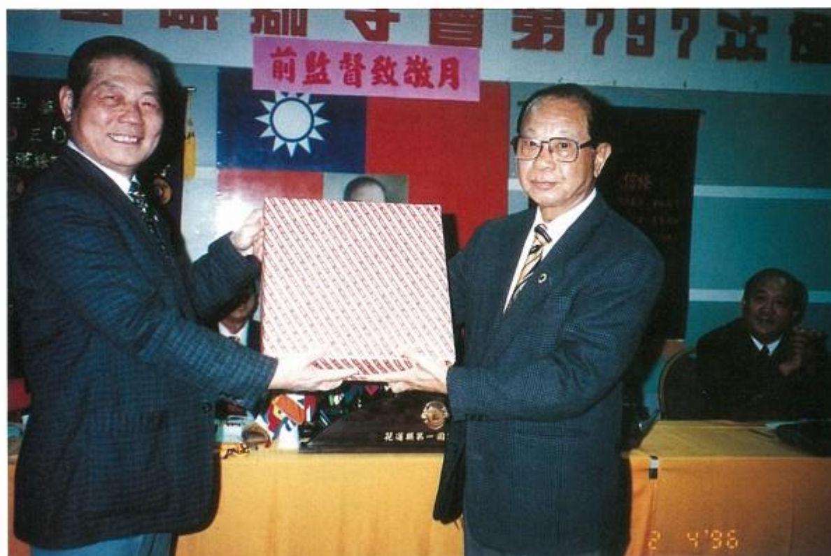
前監督致敬月，會長贈送前監督紀念品