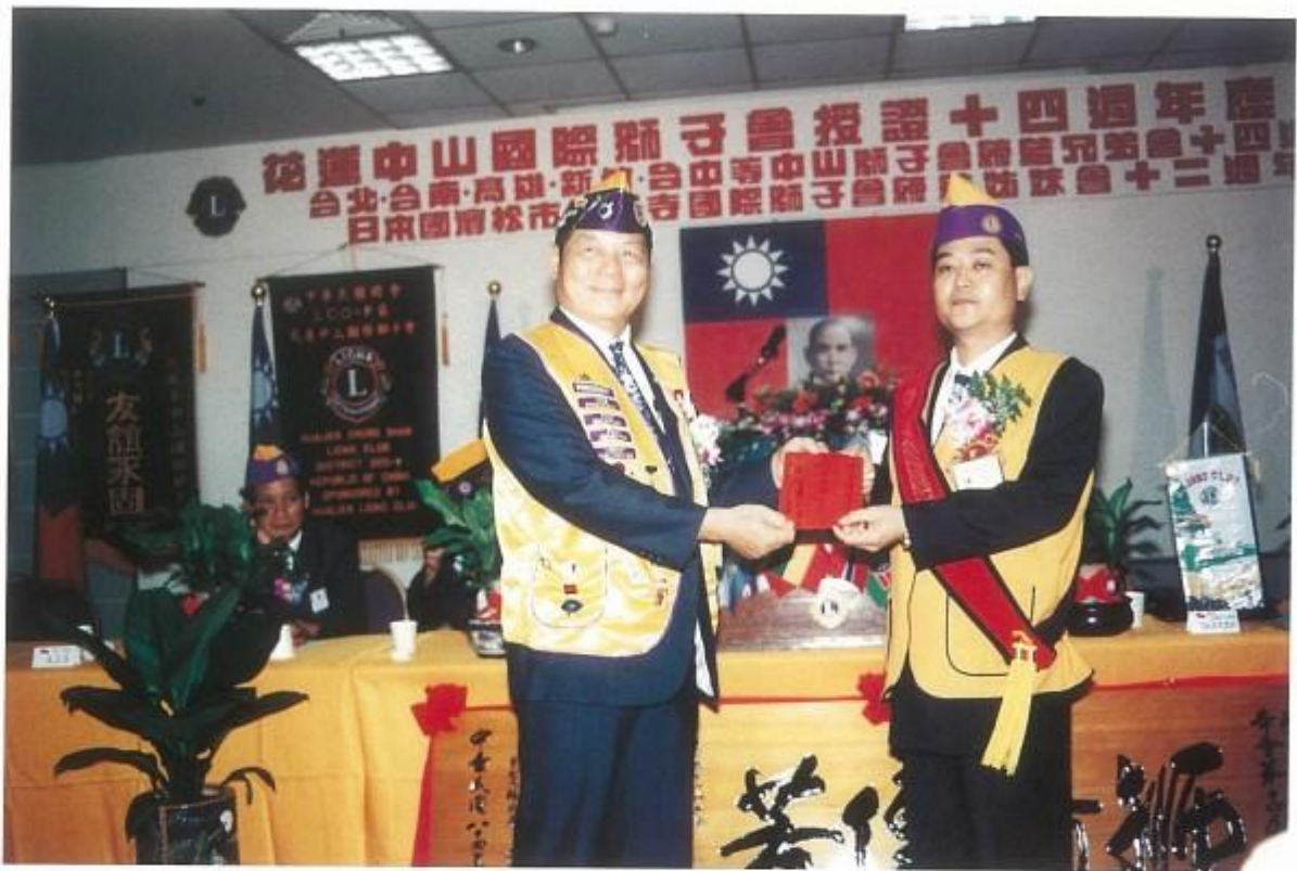
組團參加子會中山會授證典禮，並贈送社會服務金