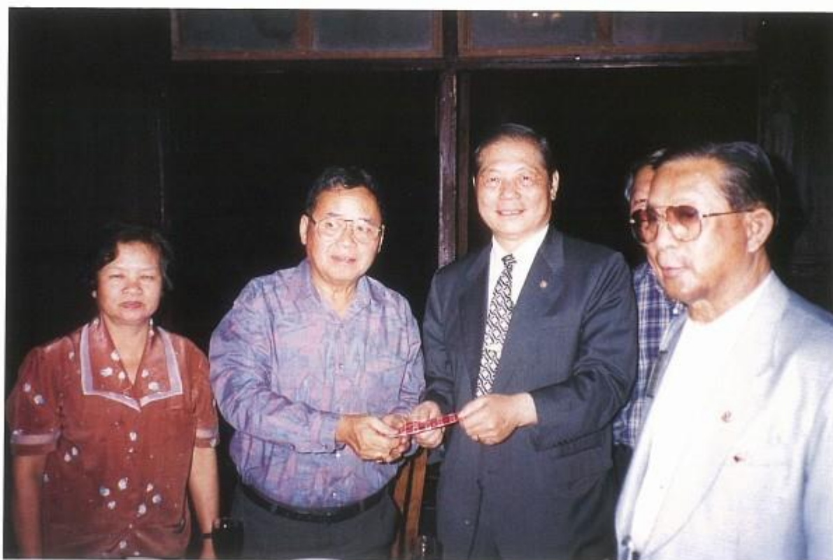
贈送清萊會社會服務金