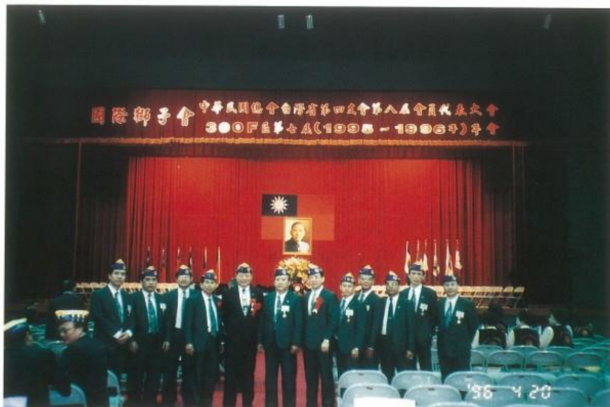
正副代表12人參加F區年會在會場內合影