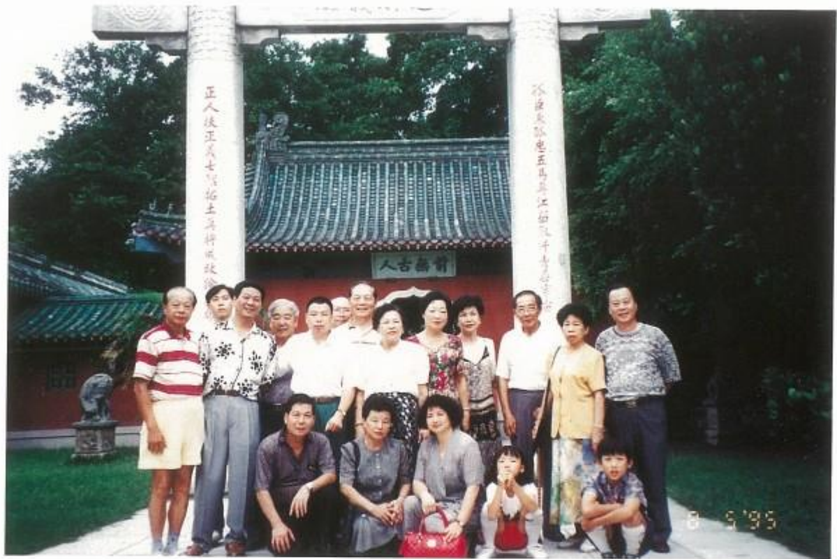
自強活動暢遊中、南部各地名勝古蹟