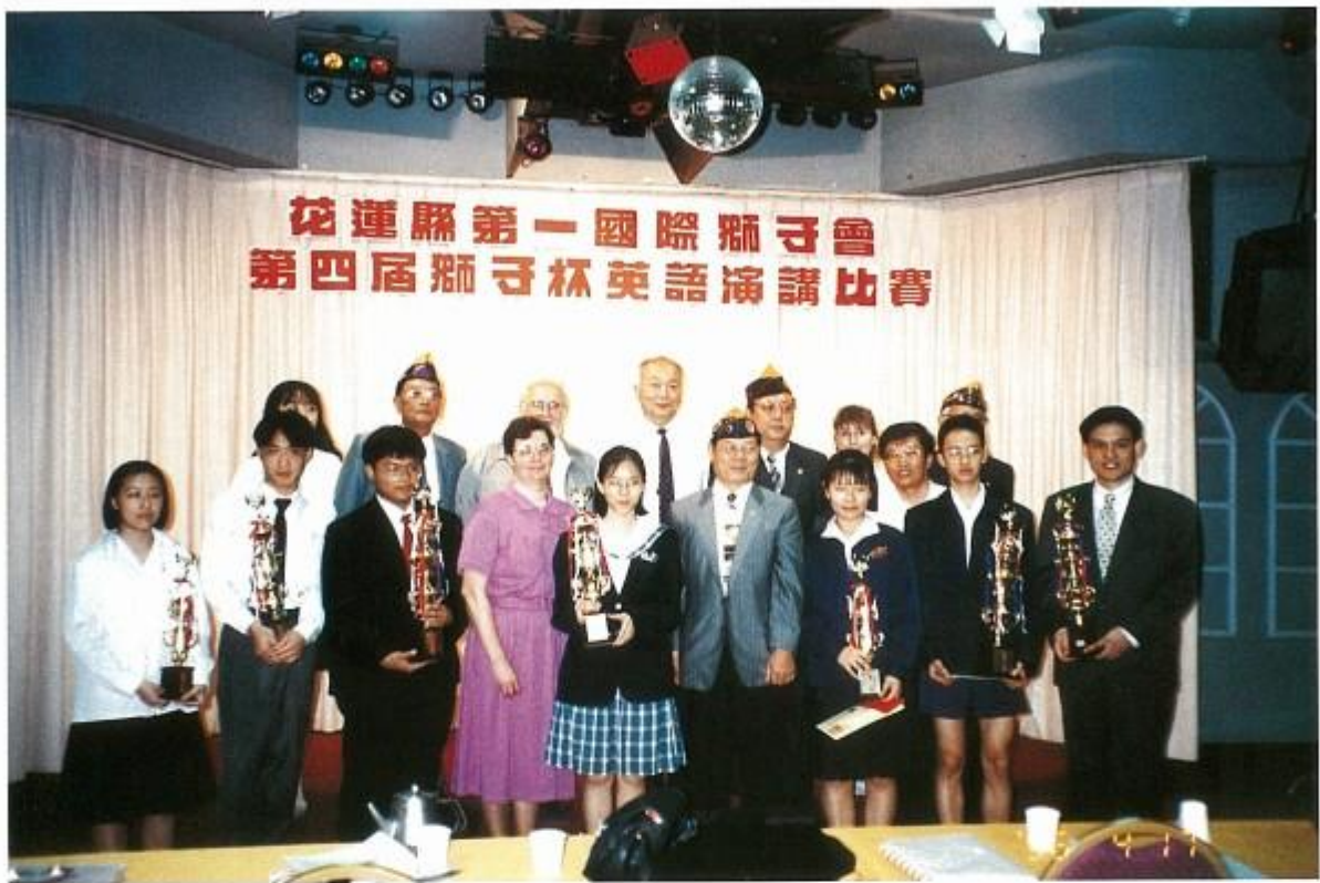
舉辦獅子杯英語演講比賽，各組優勝者合影留念