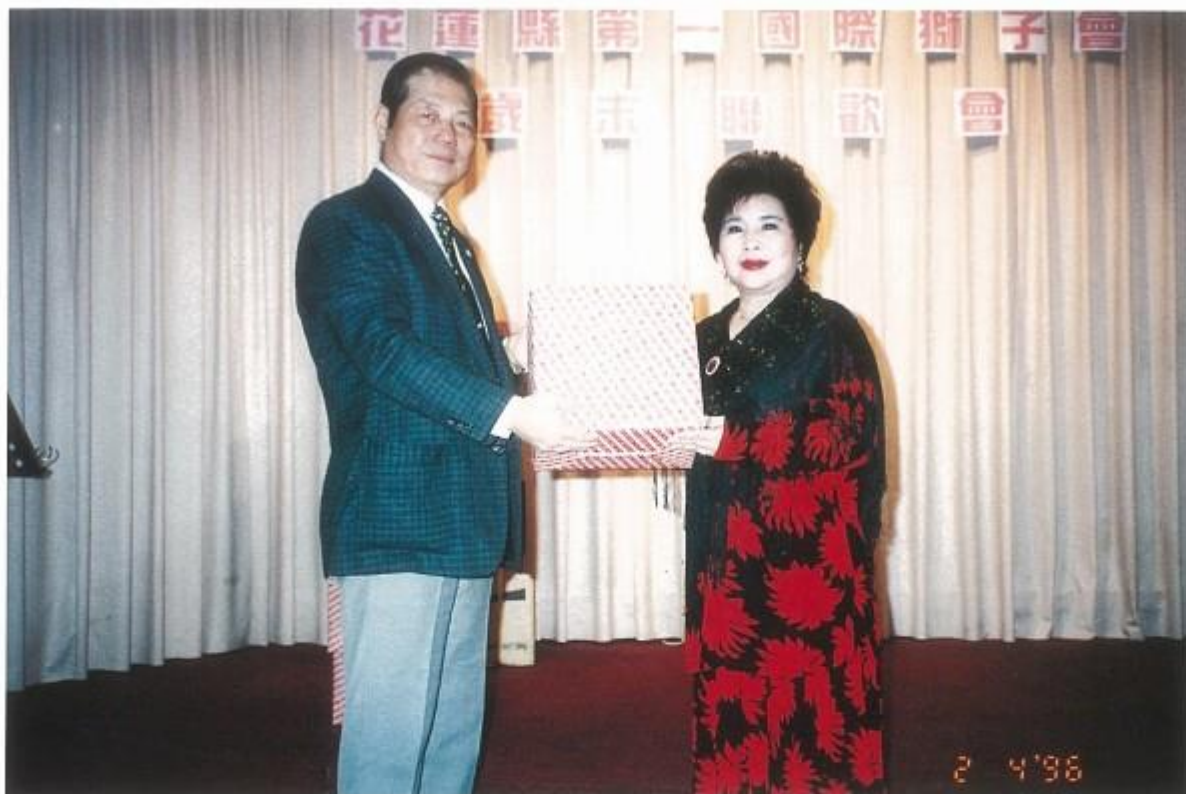
歲末聯歡會邀請子會蓮花會參加，會長贈送盧會長紀念品