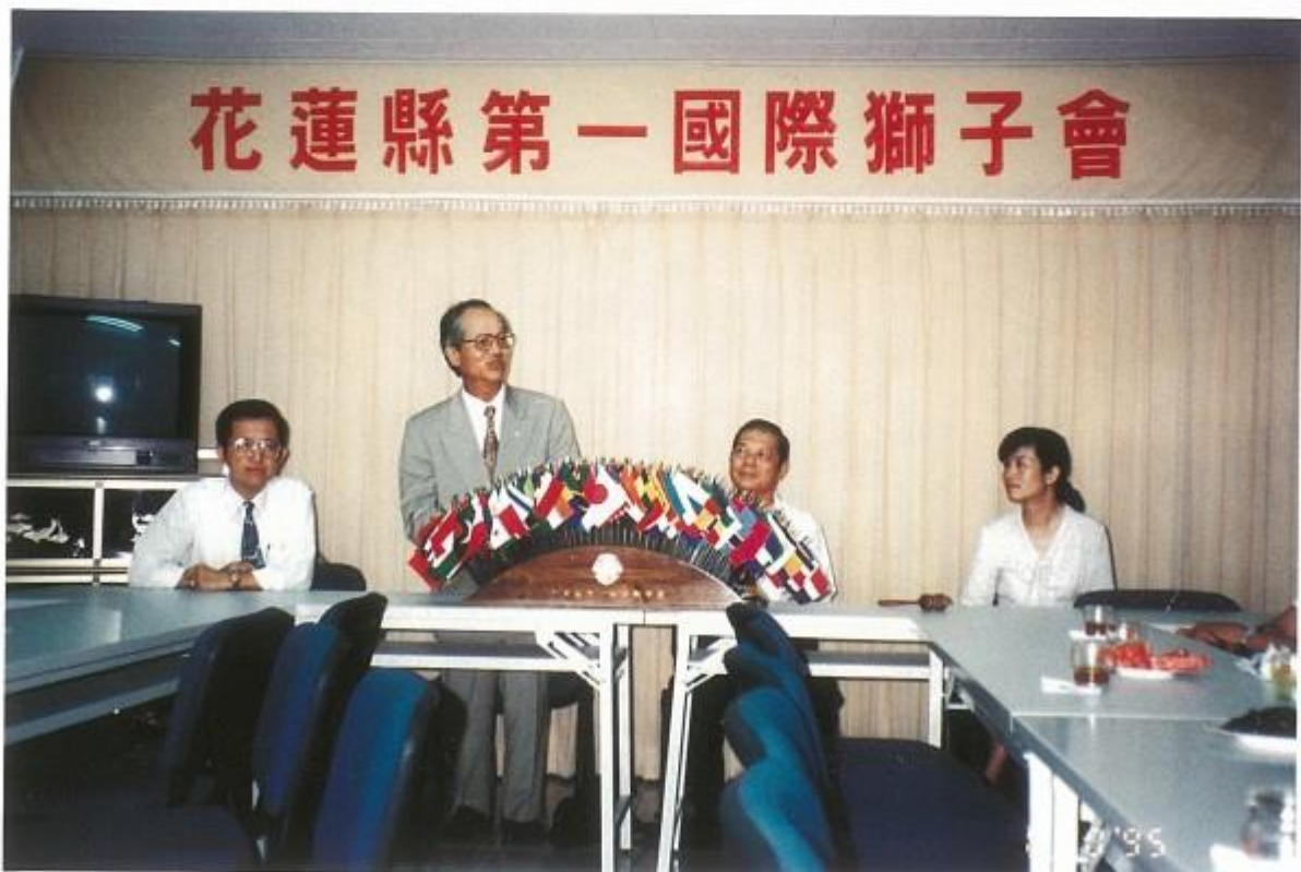
母會北區會陳會長組團訪問本會會館，並拜訪善牧中心做社會服務