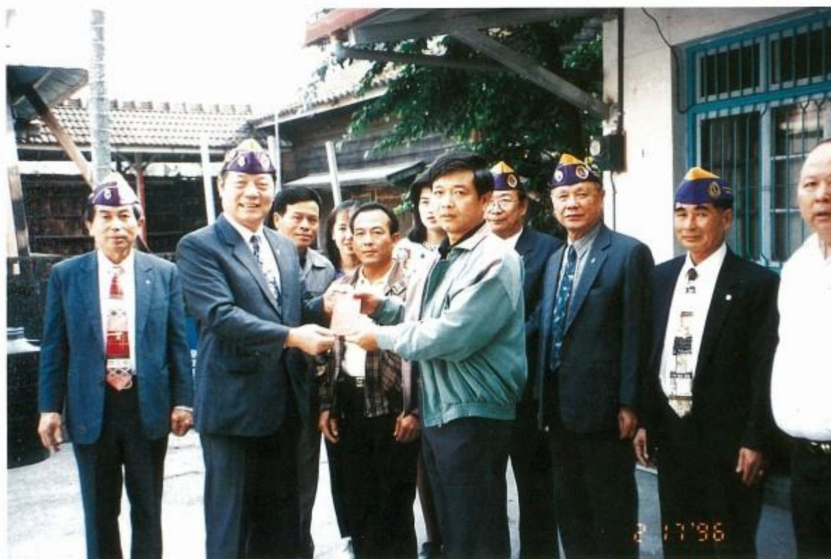
贈送清潔隊春節慰問金