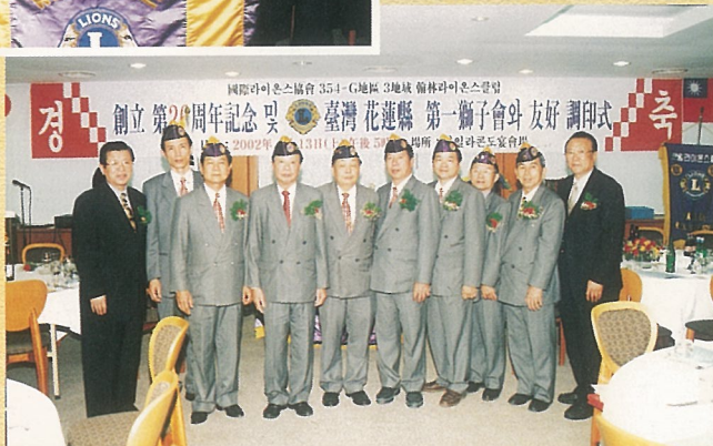
← 參加友好會締盟典禮獅友。