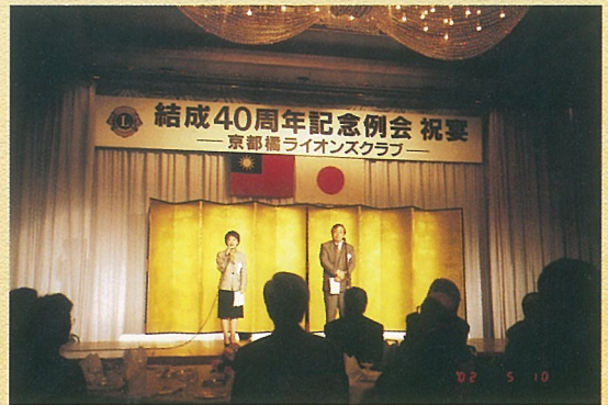
↑ 參加日本京都橋姐妹會授證40週年紀念大會。