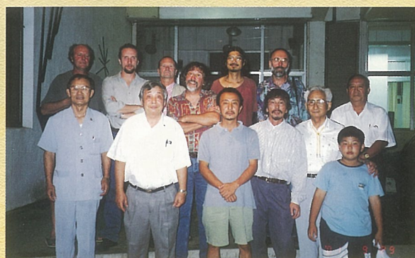
↑ 花蓮石雕藝術季活動擔任接待家庭，邀請國際石雕藝術家參加中秋晚會餐敘。