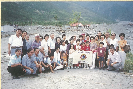
↑ 「大地啓示錄活動」，關懷桃芝颱風大興災區。