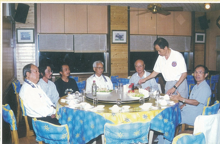
↑ 接待國際石雕藝術家餐敘。