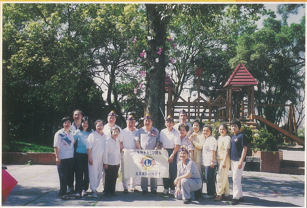
↑ 美崙山自然生態蘭花公園前合影。