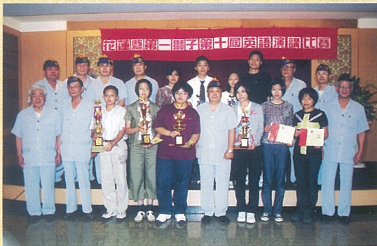
↑ 第十屆獅子杯英語演講比賽。