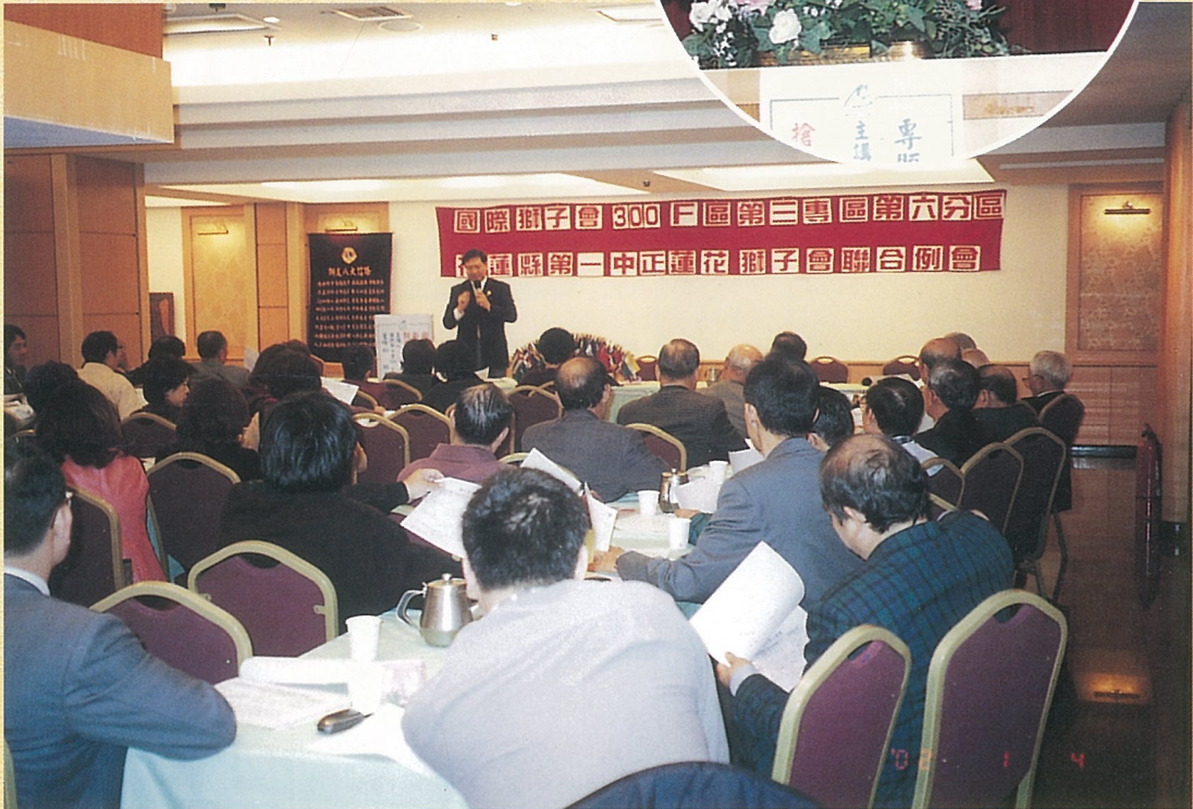
↑ 第六分區聯合例會。