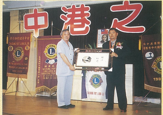
↑ 贈送台中港兄弟會紀念品。