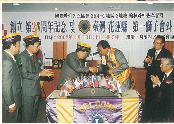
↑ 與韓國翰林獅子會締結友好會。