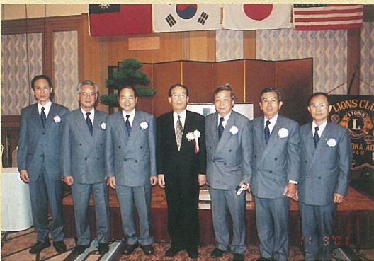
↑ 參加日本靜岡葵姐妹會授證40週年紀念大會。