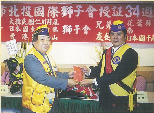
↑ 贈送北投兄弟會聯合社會服務金。