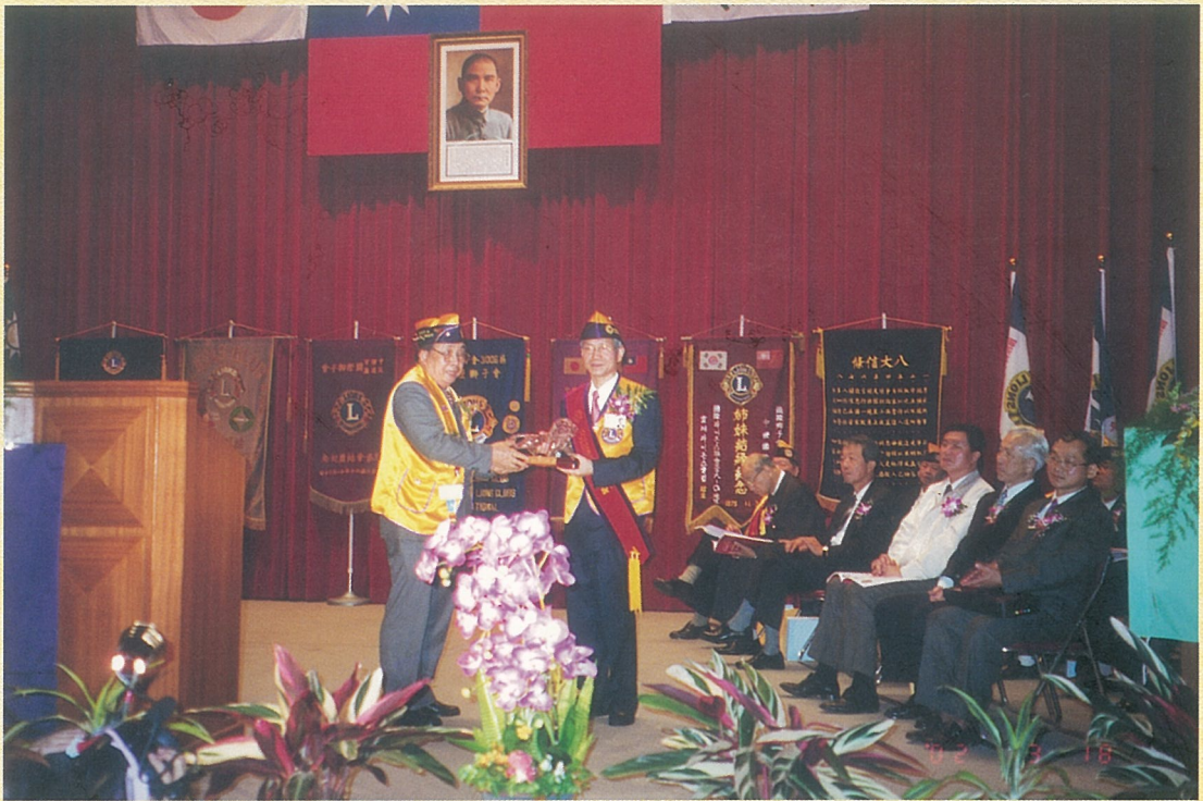
↑ 劉會長代表本會贈送中壢兄弟會紀念品。