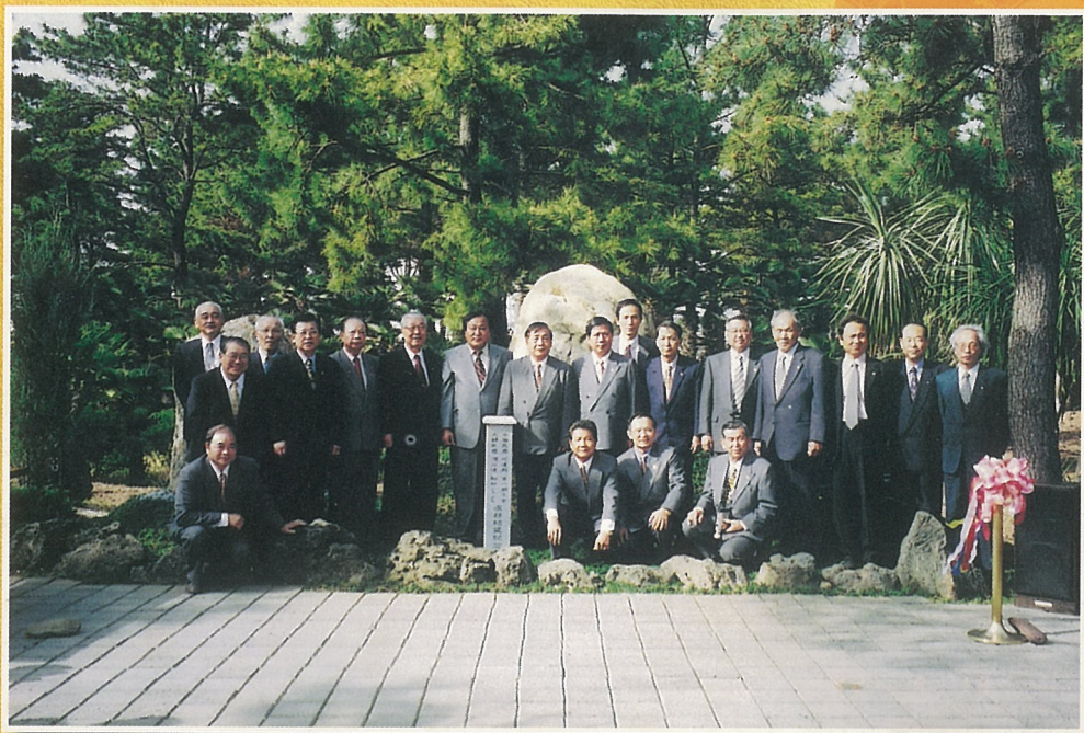
↑ 韓國翰林公園結盟紀念石碑前合影。