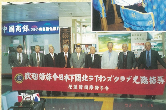
↑ 花蓮機場迎接日本下關北姐妹會獅友來訪。