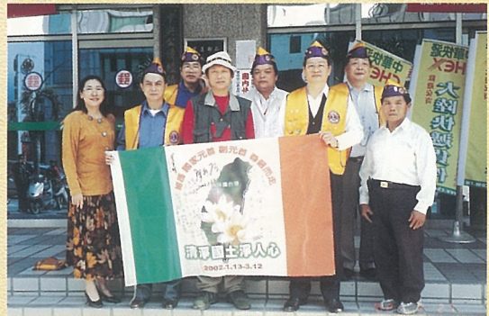
↑ 參加台灣環保行腳活動。