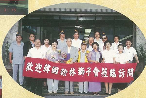
↑ 歡迎友好會韓國翰林獅子會獅友來訪。