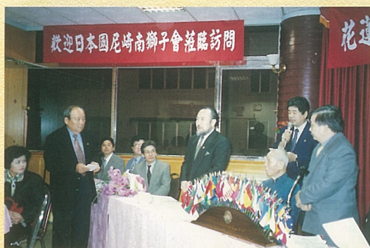
↑ 日本尼崎南獅子會參加本會例會。