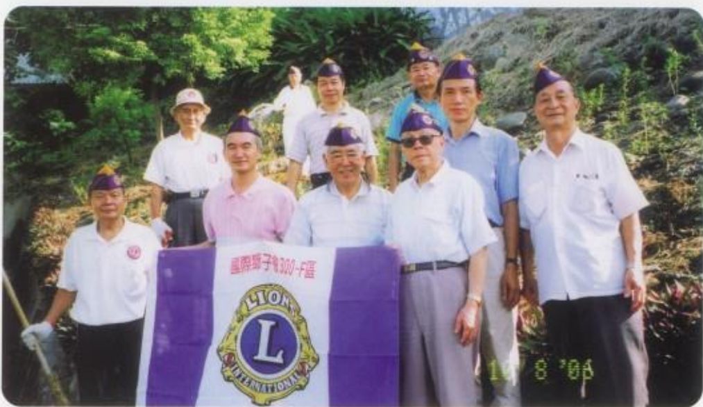
獅友服務日清掃獅子公園