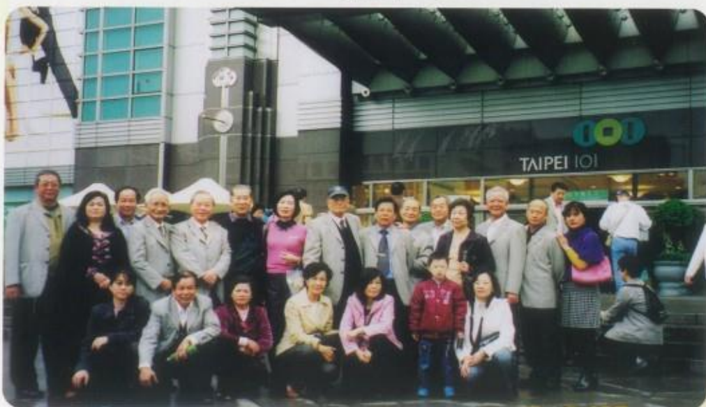
自強活動參觀台北101大樓