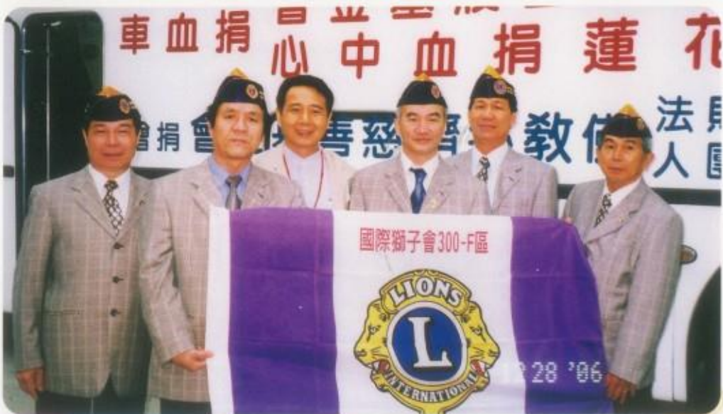
本會愛心捐血活動