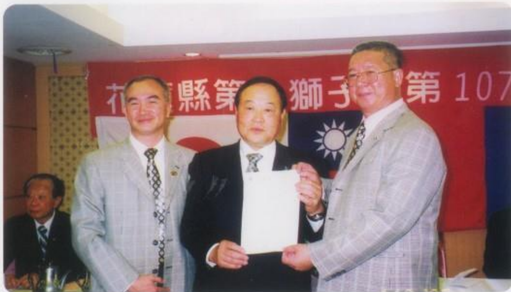
日本尼崎友好會參加例會