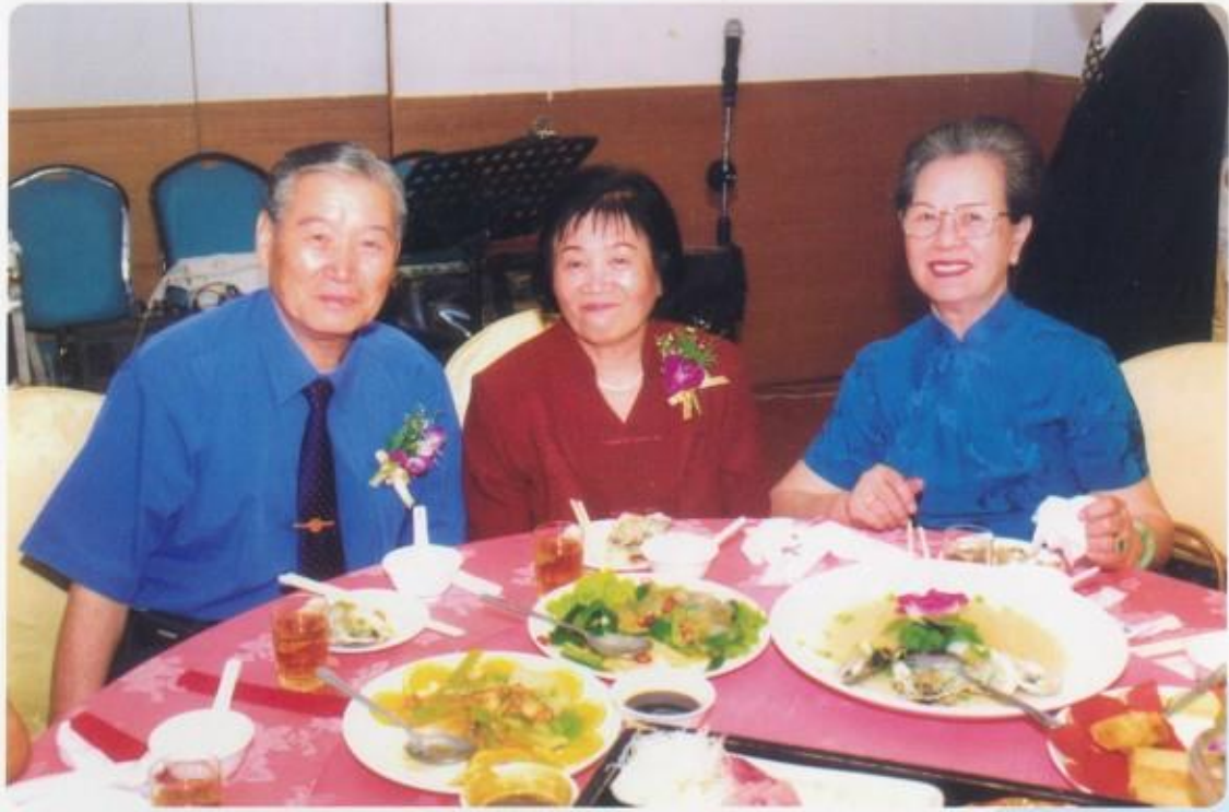
樂～嚴父慈母與秀寶阿姨