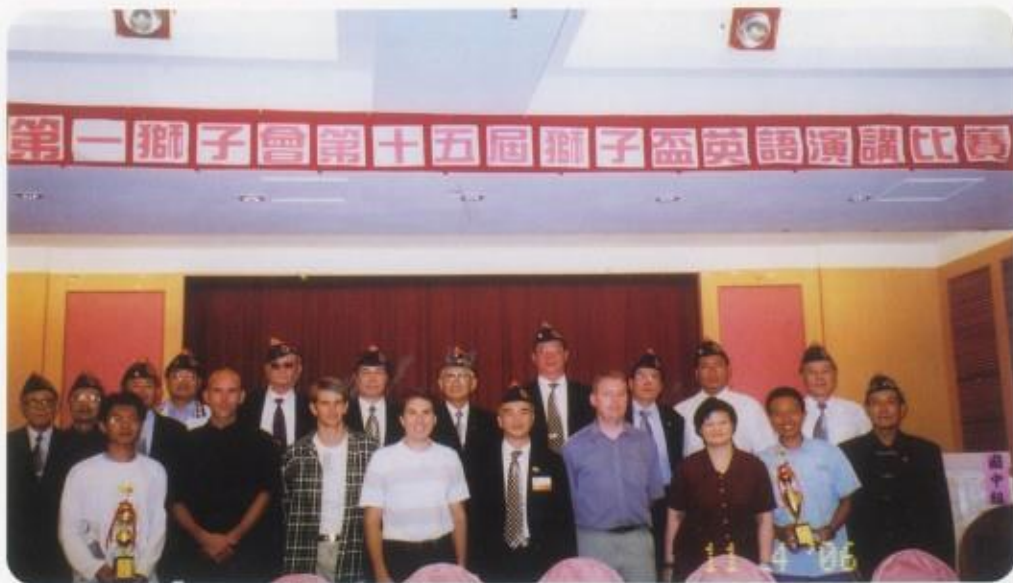
第十五屆獅子杯英語演講比賽