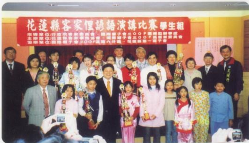
客家俚諺語演講比賽與得獎人員合影