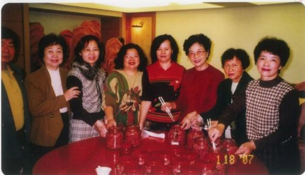
獅嫂聯誼～「紅槽製作」