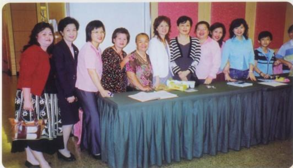
客家俚諺語演講比賽幕後工作群