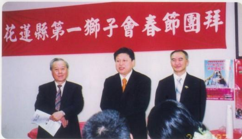
春節團拜，立法委員傅崐萁獅兄致詞