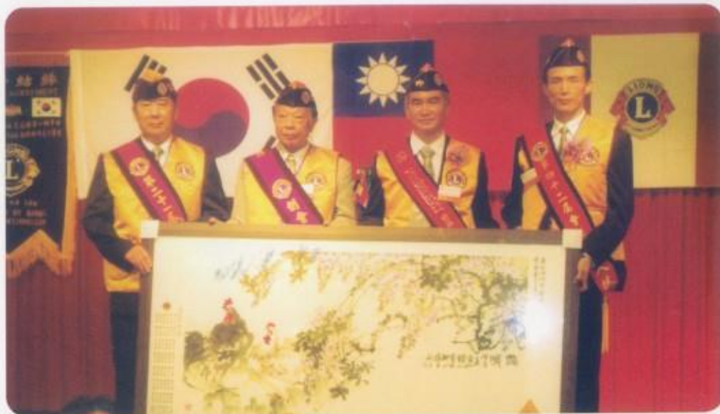
贈送第43屆吳會長紀念品