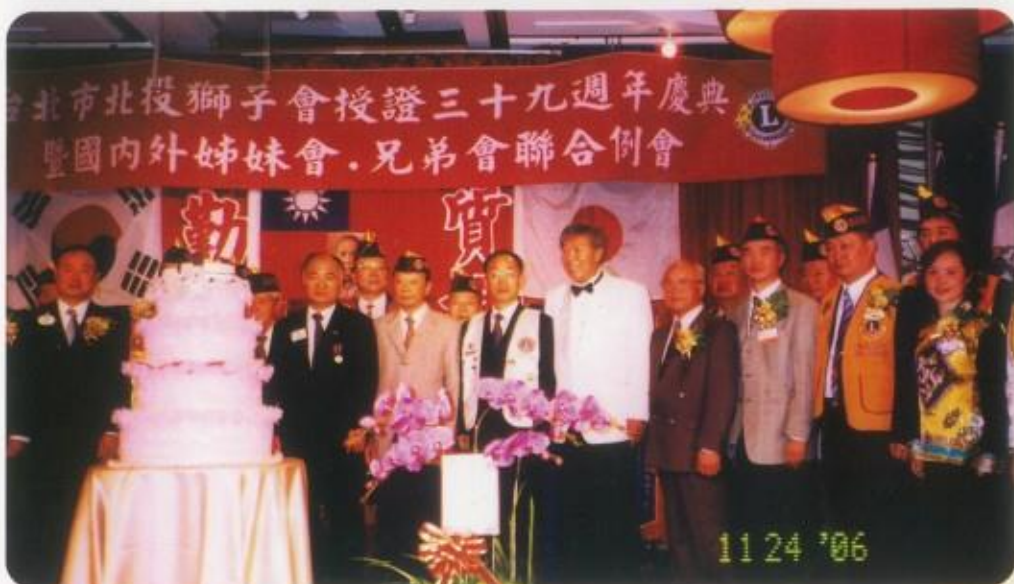
參加北投兄弟會授證39週年紀念大會