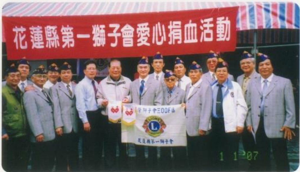
本會愛心捐血活動