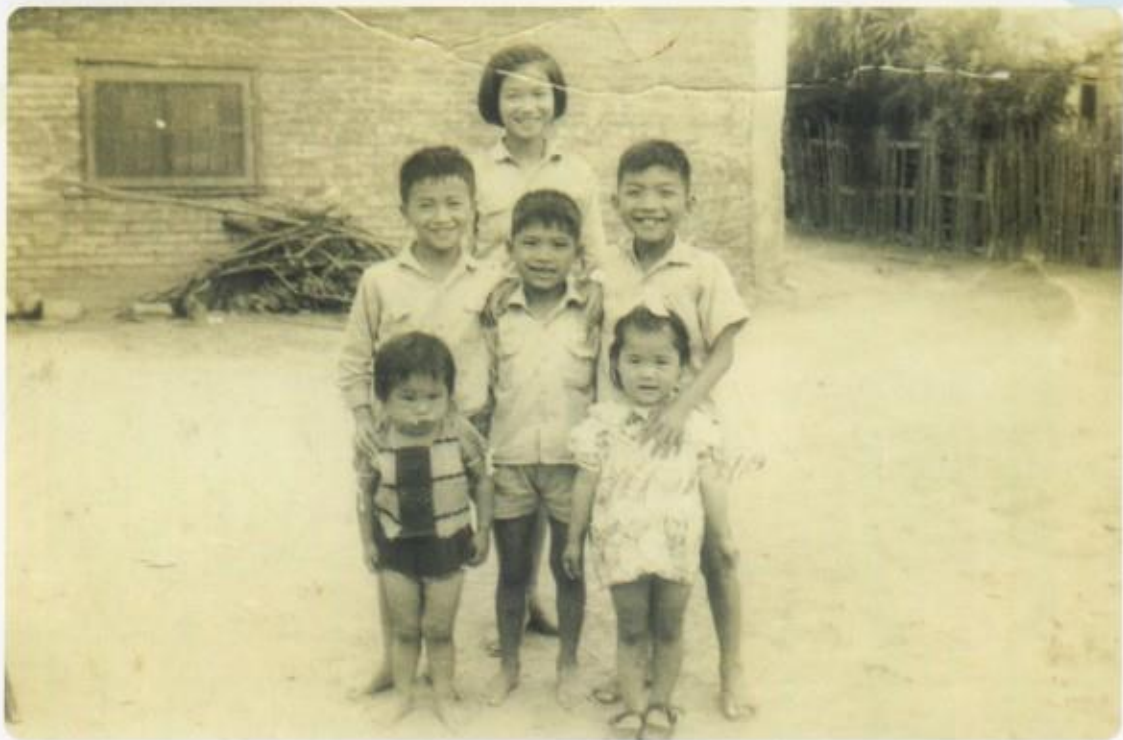
青梅竹馬～猜猜看,40年前的吳會長賢伉儷是那兩位?