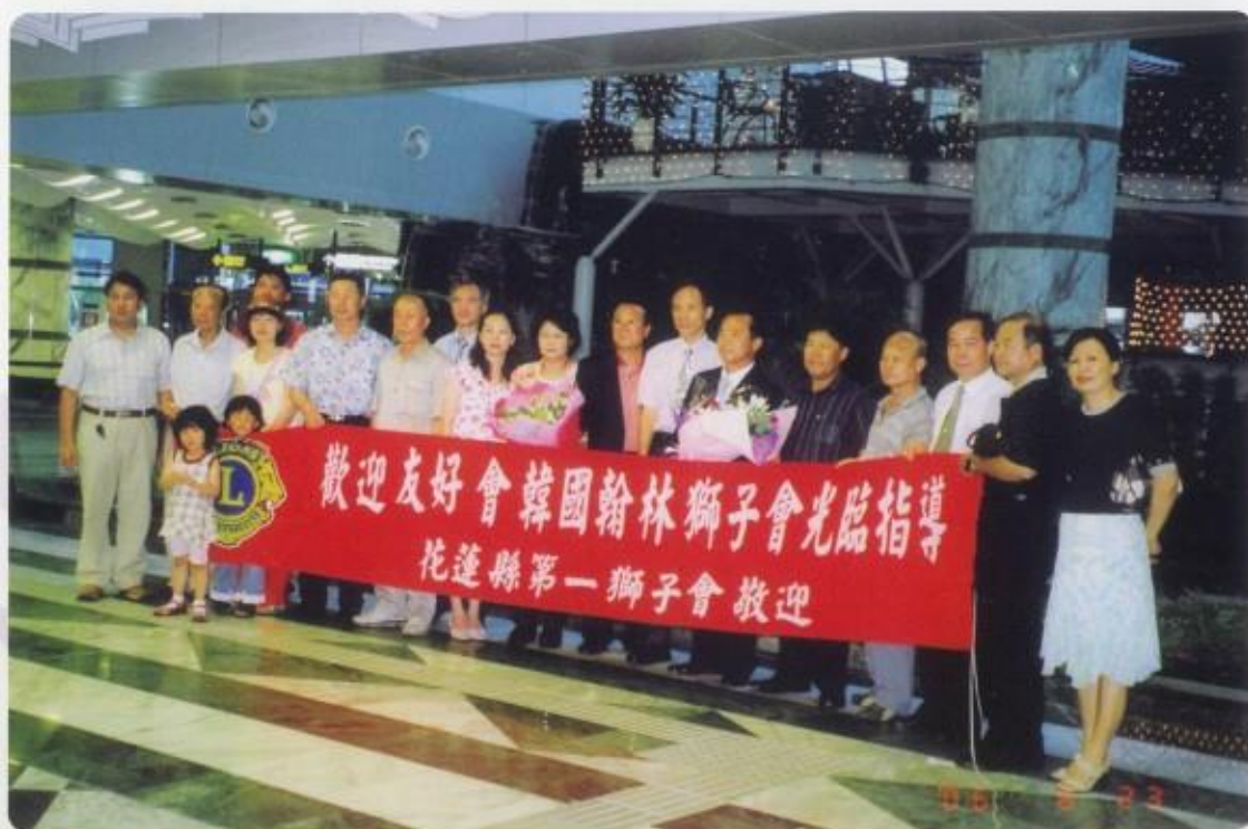
歡迎韓國翰林友好會來訪