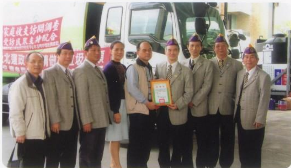
慰問吉安鄉清潔隊