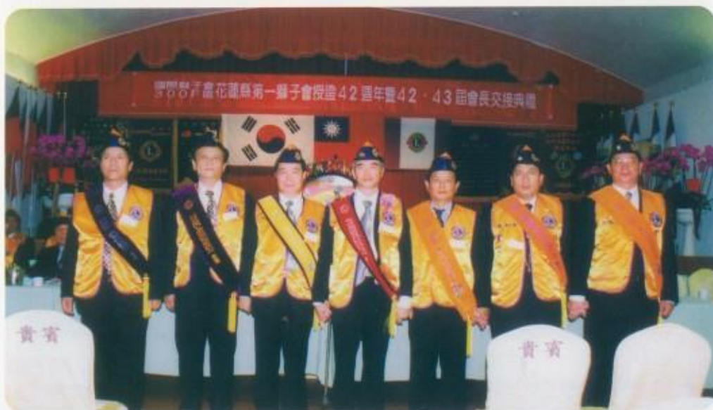
堅強內閣與一、二、三副會長