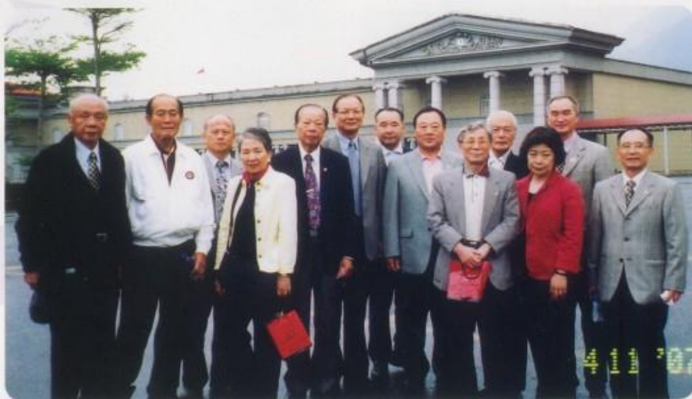
尼崎友好會獅友參觀光隆科技博物館