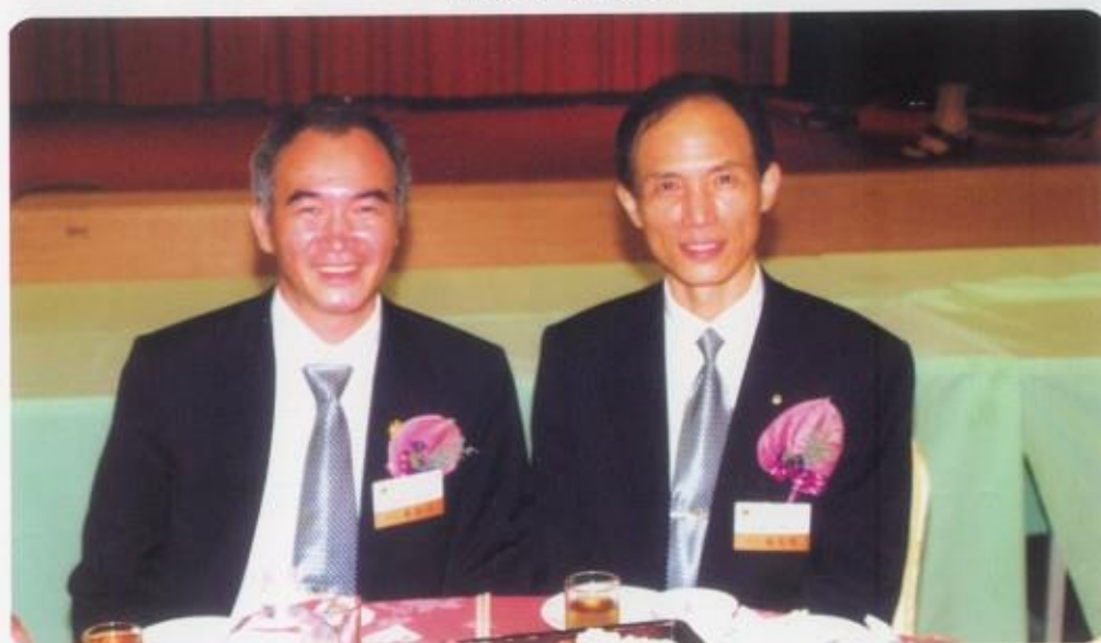
前任會長亦是兄弟