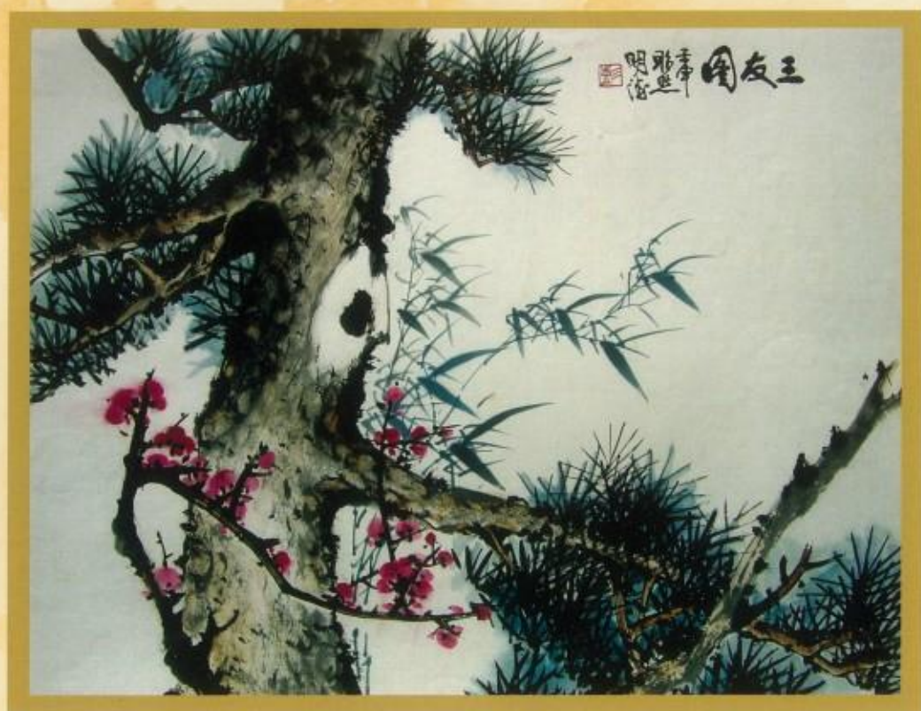
畫/彭明德獅兄 提供