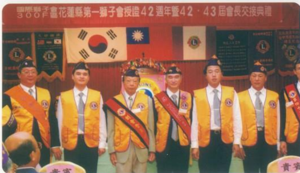
新進獅兄-明日的會長