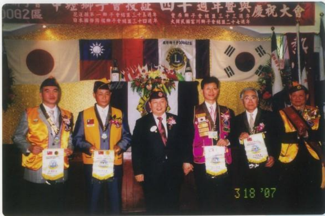
參加中壢兄弟會授證40週年紀念大會