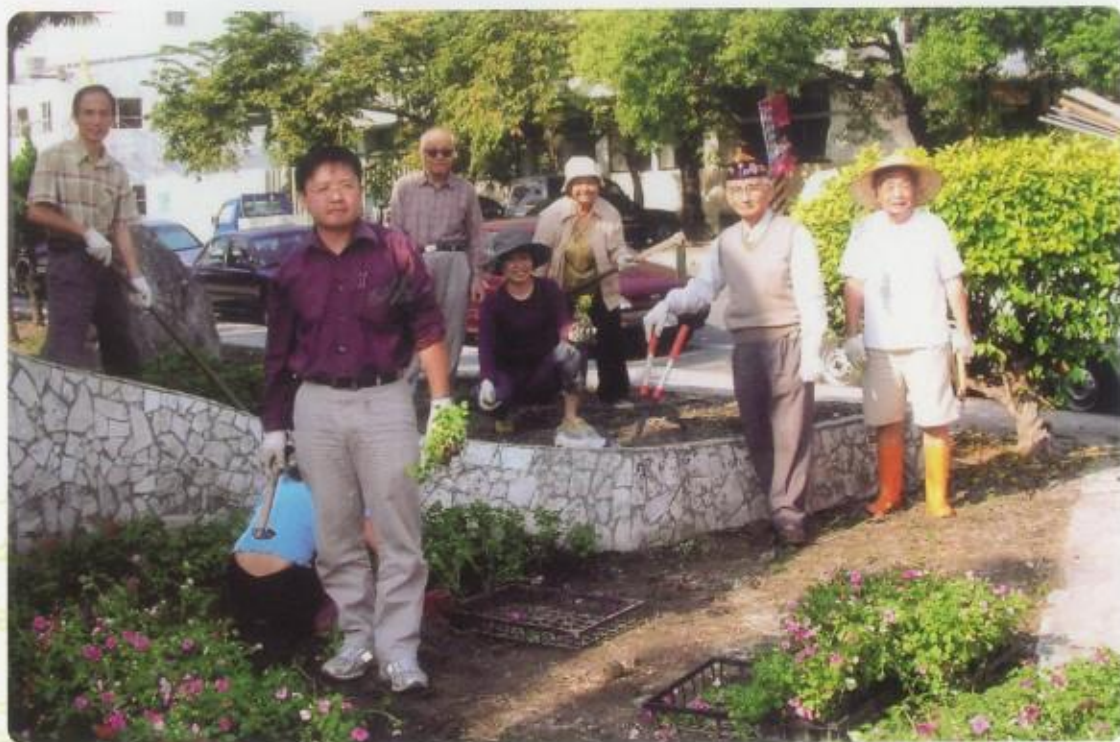
美化市容栽植鳳仙花及一串紅