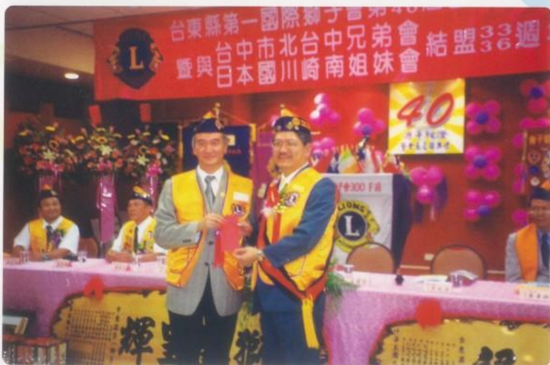
致贈聯合社會服務金