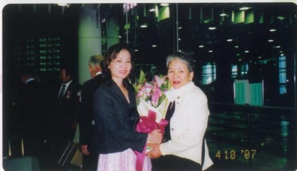
吳會長夫人代表獻花