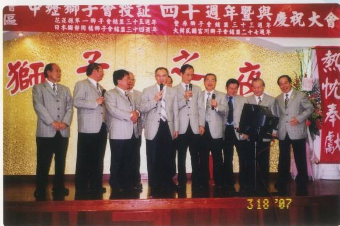
上台秀一段~你是我的兄弟