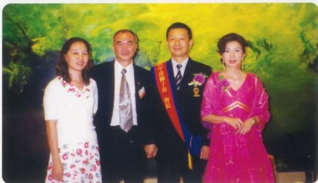
與台中港兄弟會游會長賢伉儷合影