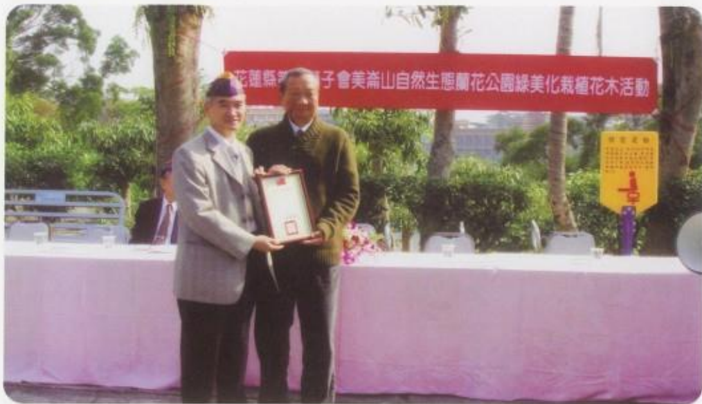
蔡市長頒發認養證書