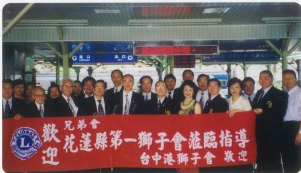
台中港兄弟會在車站熱誠迎接