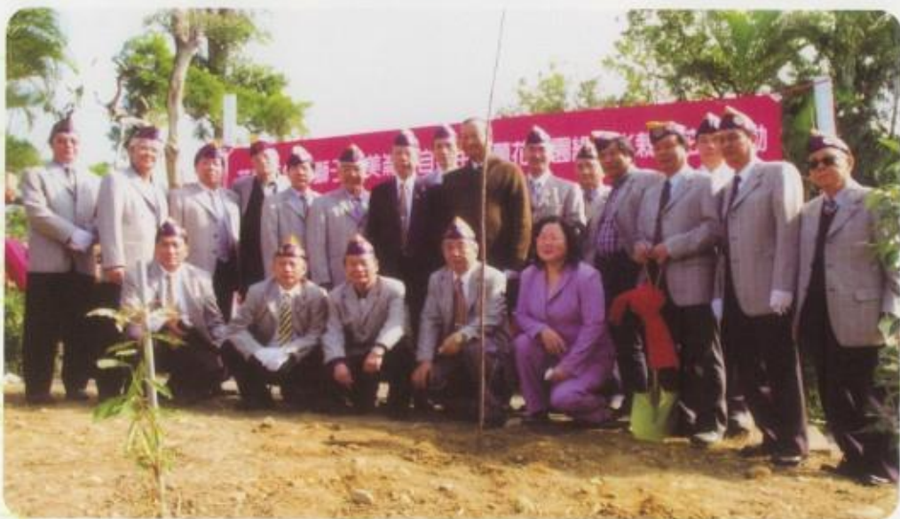
美崙山自然生態蘭花公園綠美化栽植花木活動