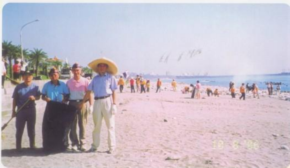
參加第三、九專區聯合淨灘活動