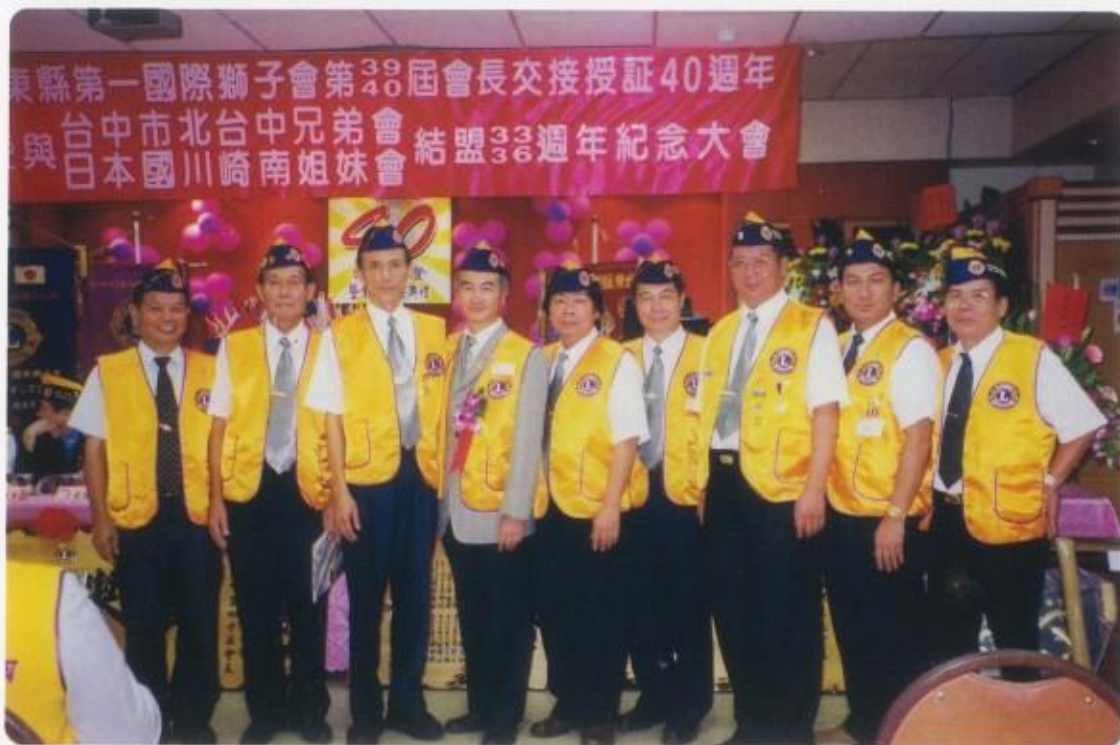
參加台東縣第一獅子會授證40週年紀念大會