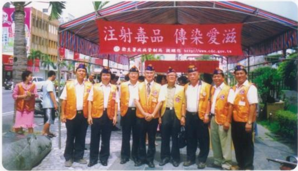
參加第三、九專區聯合捐血活動