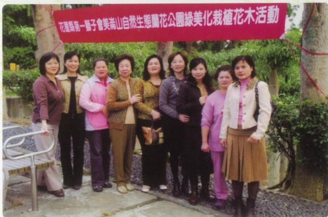
社會服務工作的幕後推手～獅嫂