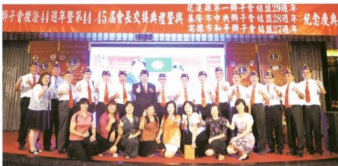
本會組團參加兄弟會台中港獅子會授證合影留念