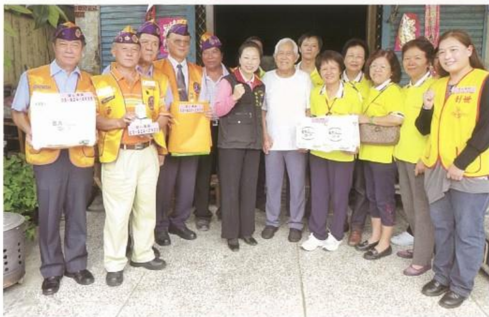
本會獅兄致贈創世基金會醫療用品