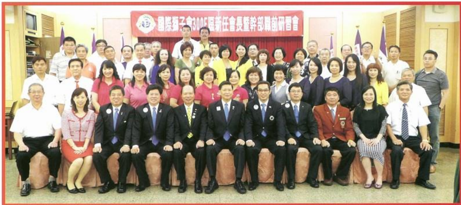
劉會長帶領新任幹部職前研習會