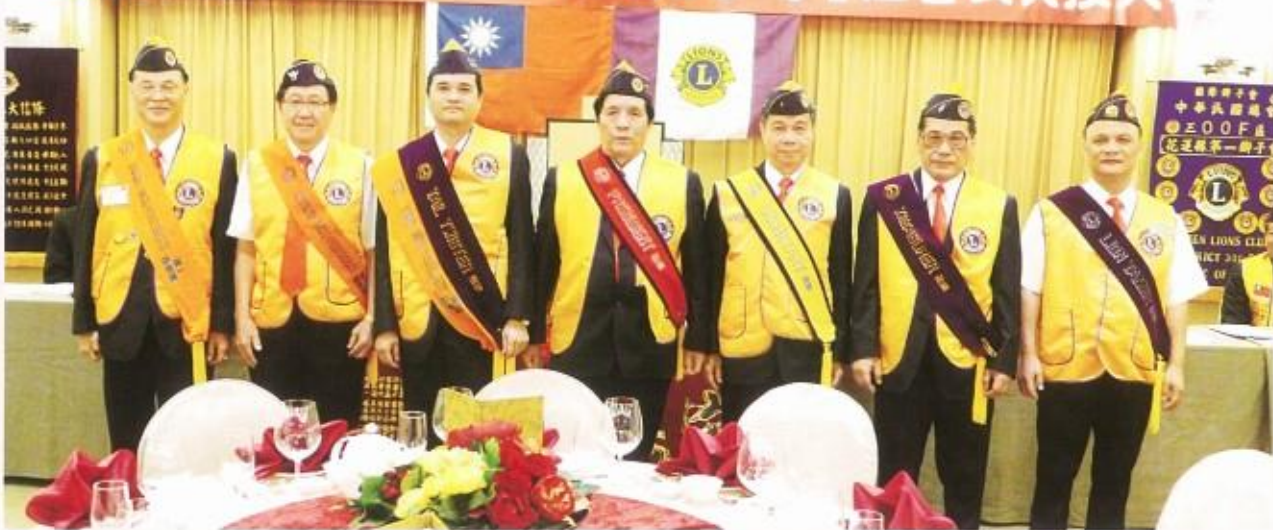
五十一屆堅強的 幹部服務團隊