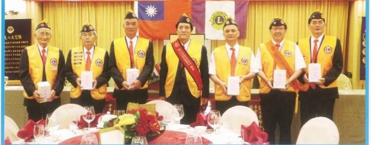
頒辛苦聯絡 組長獎