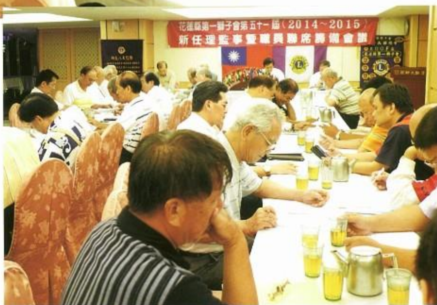
職員聯席籌備會 出席踴躍(之二)