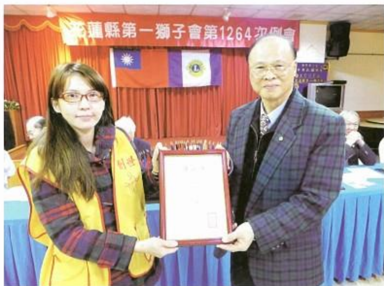
贈創世基金會 三十萬元，致贈 感謝狀