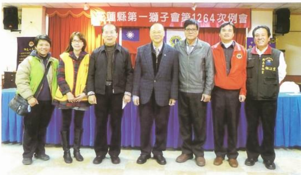
創世基金會工作人員蒞會感謝