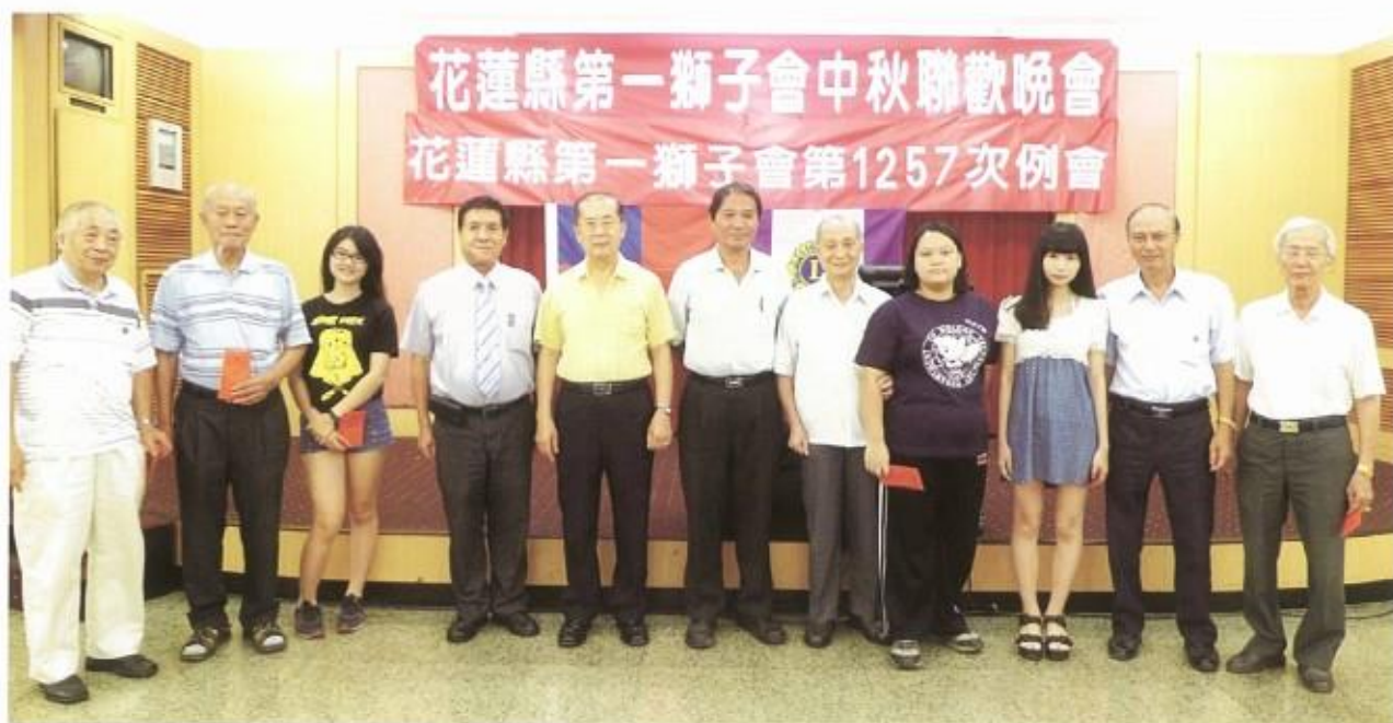
劉會長於中秋晚會上 頒贈子女獎學金