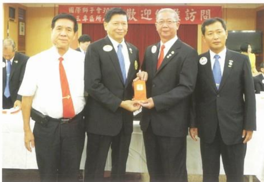
本會捐贈「CITF基金」， 駱總監代表接受