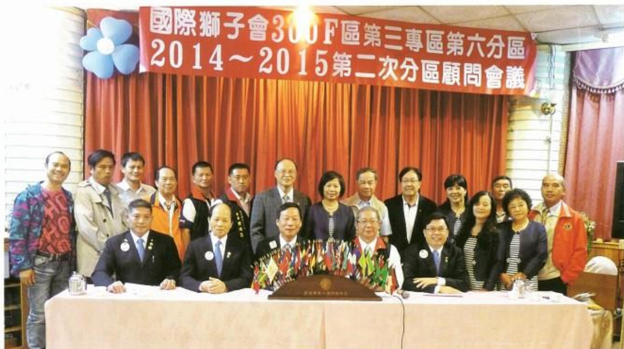
楊分區主席主持第六分區 顧問會議，會後留影