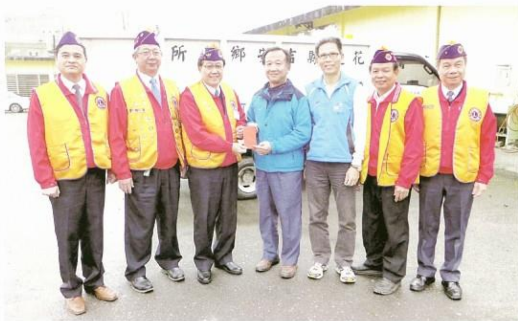
捐吉安鄉公所清潔隊 慰問金