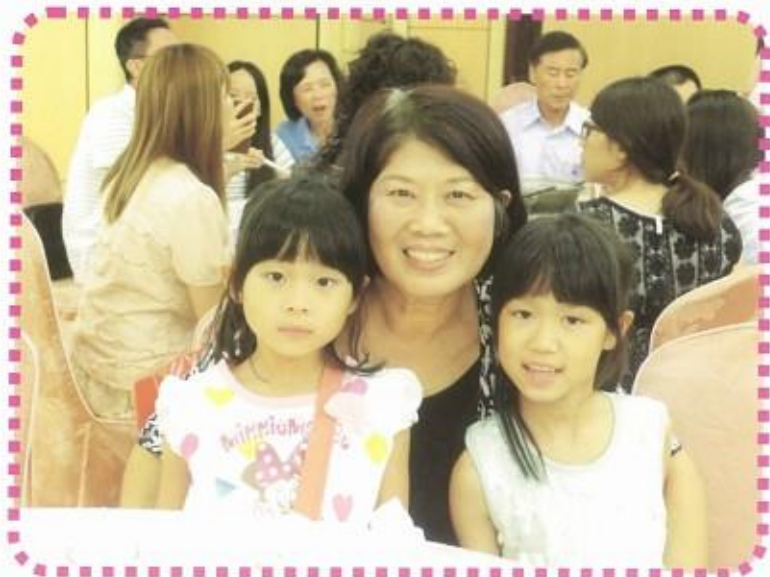
五十一屆中秋聯歡晚會， 獅嫂帶著可愛的孫女 合影