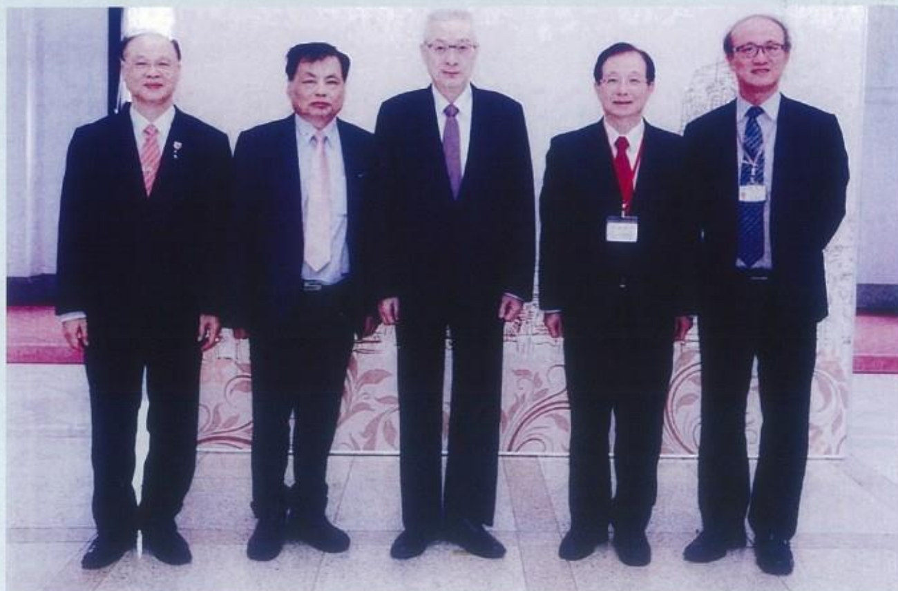
會長與吳副總統、全國幼學黃理事長、前教育部長吳部長現教育部 林次長合影