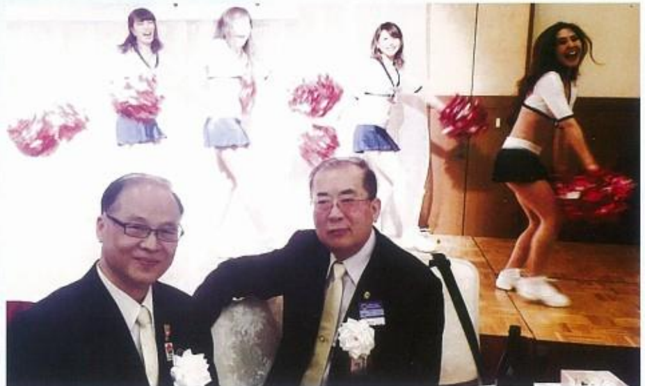
會長與邱前總監 參加獅子之夜