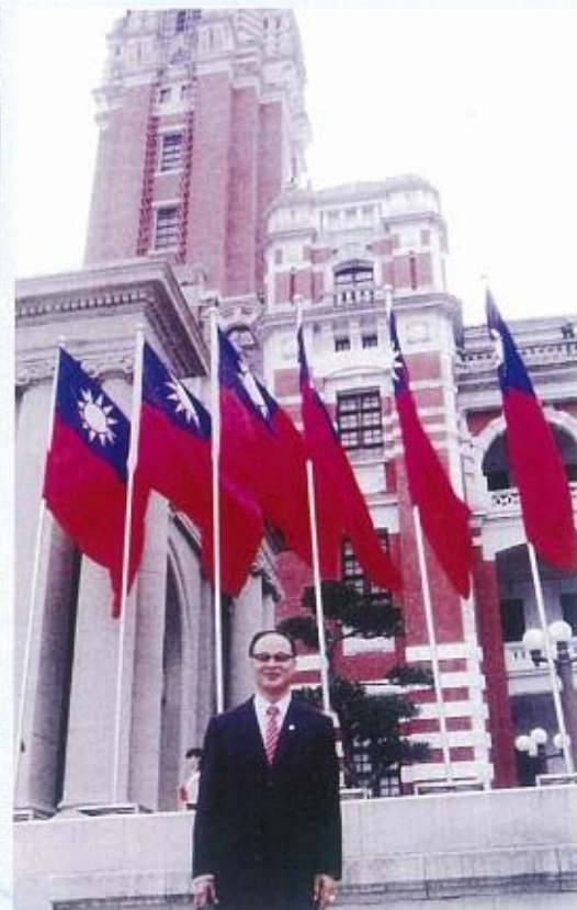
會長受獎後在總統府前留影