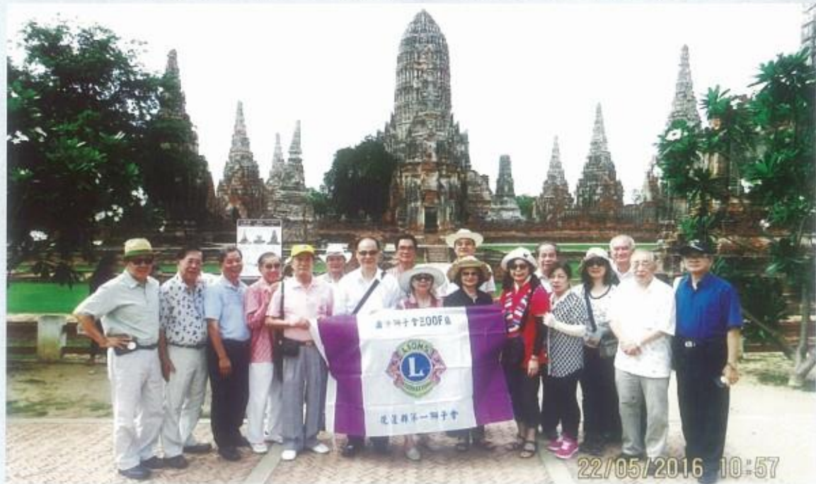
參訪阿育塔雅素寺前合影