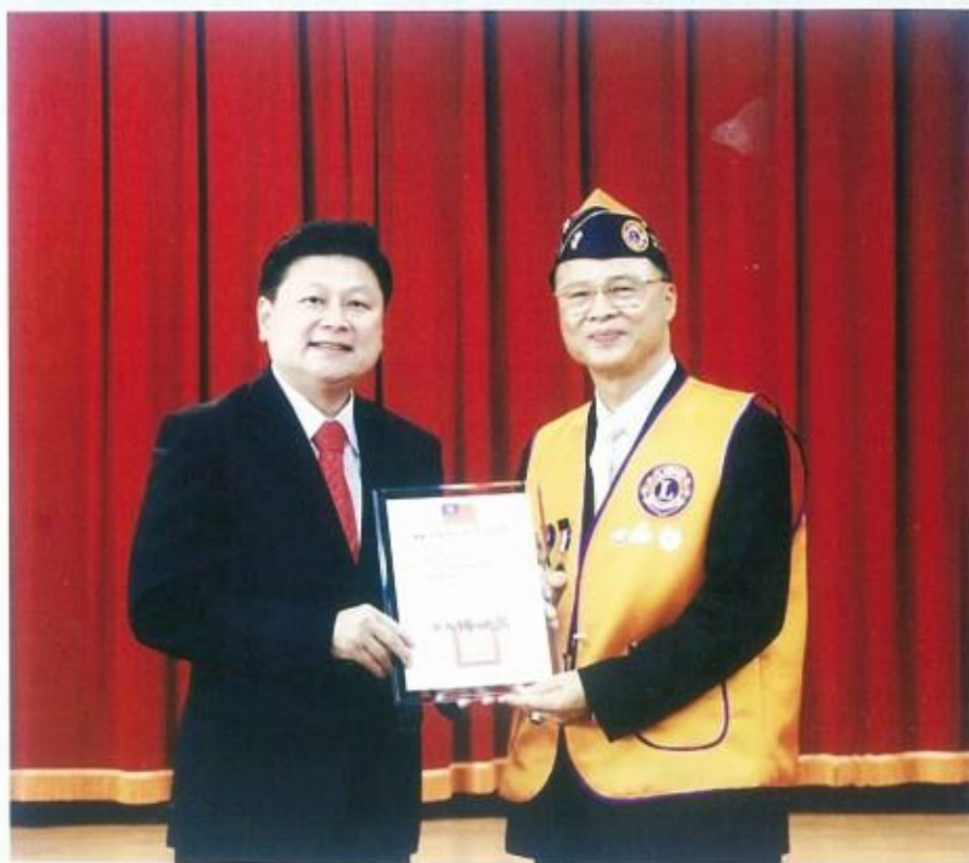
本會30萬元獎學金頒獎活動，受傅縣長頒發獎狀肯定