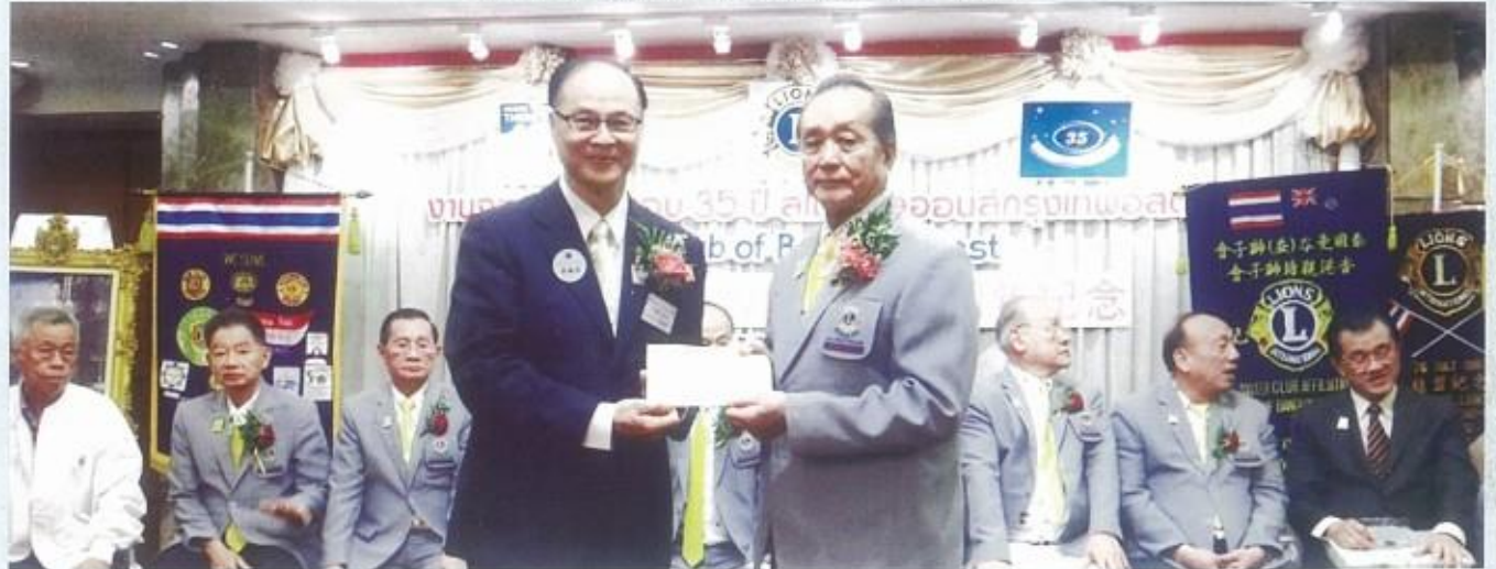
李會長致送社會服務金給曼谷益獅子會