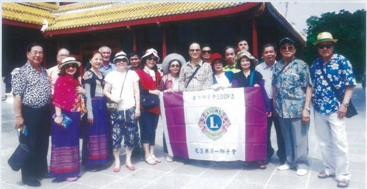
參訪挽芭茵五世皇夏宮花園入口處合影