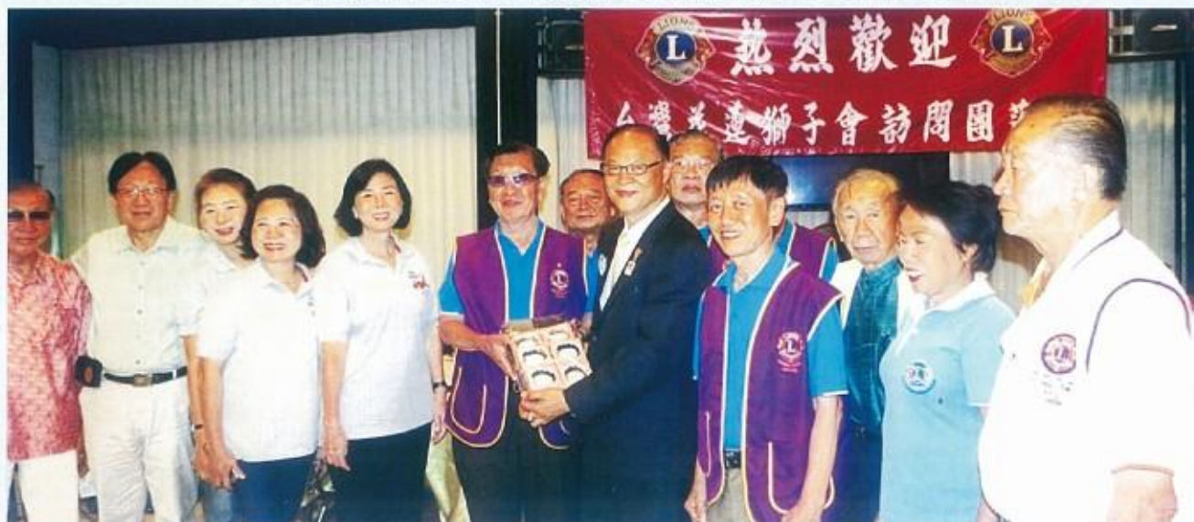
李會長贈送那空素旺全體獅友紀念品