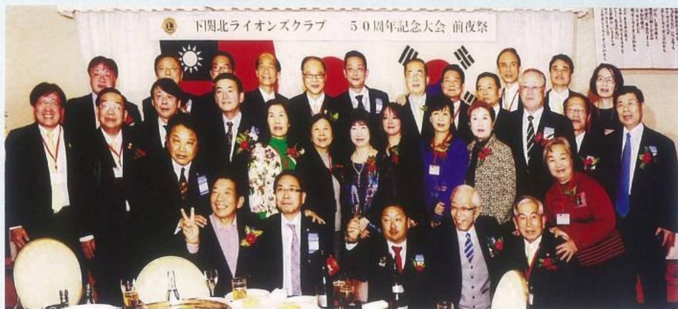
攝於下關北獅子會授証50週年會場