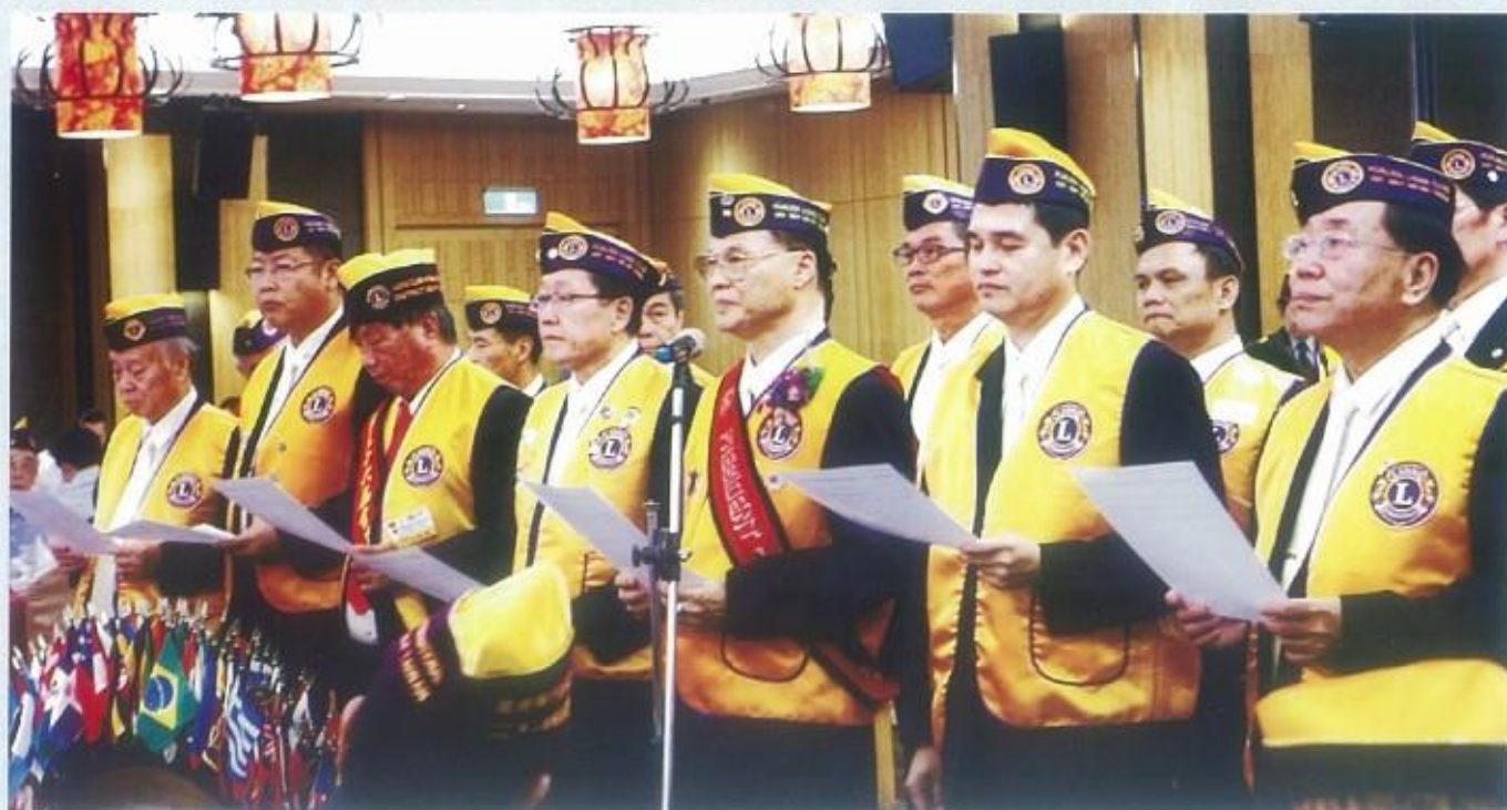
新任會長團隊就職宣誓