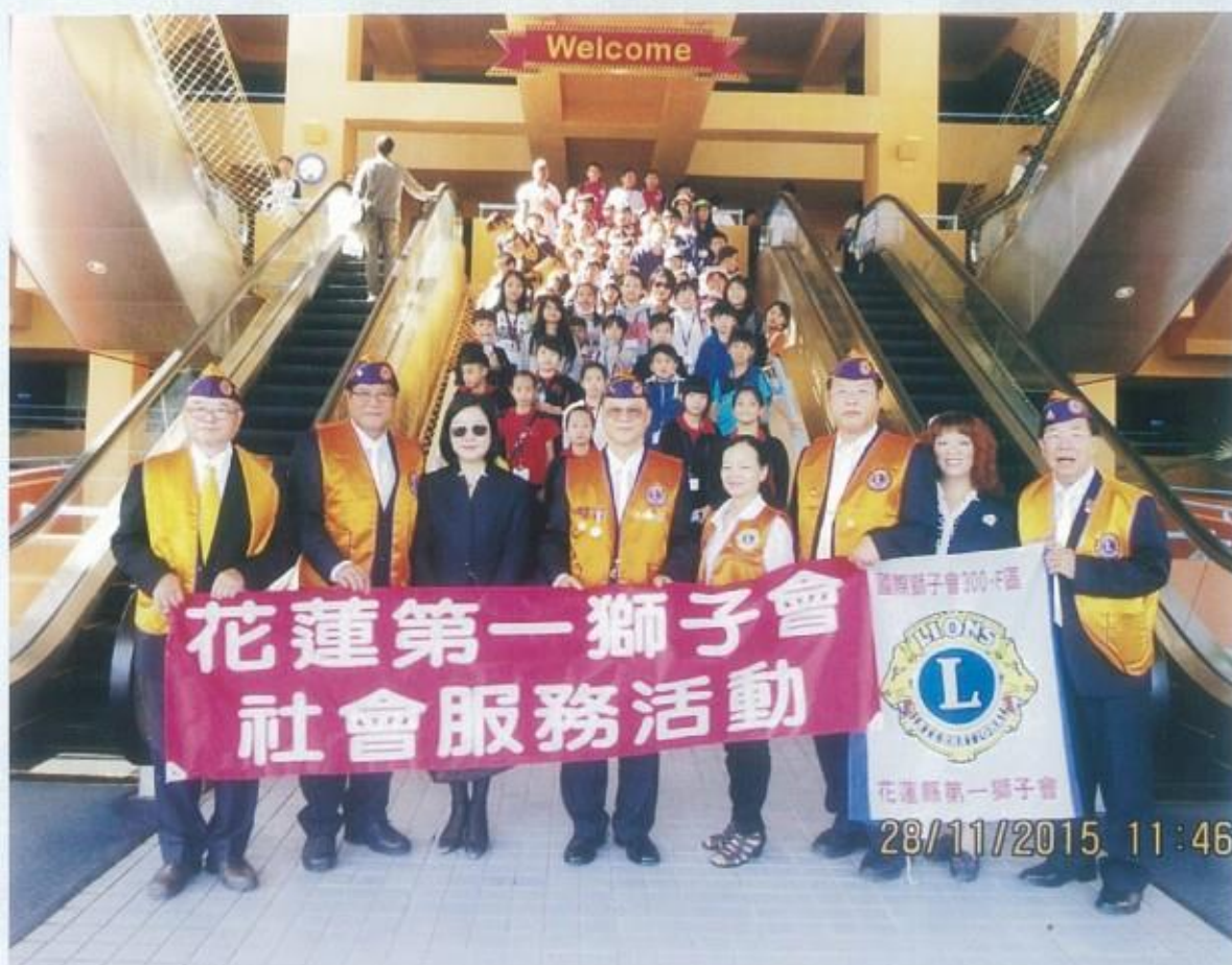
招待受獎學生120名參觀海洋公園