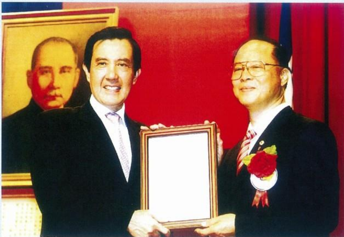
當選全國敬軍楷模接受馬總統英九先生親自頒獎表揚