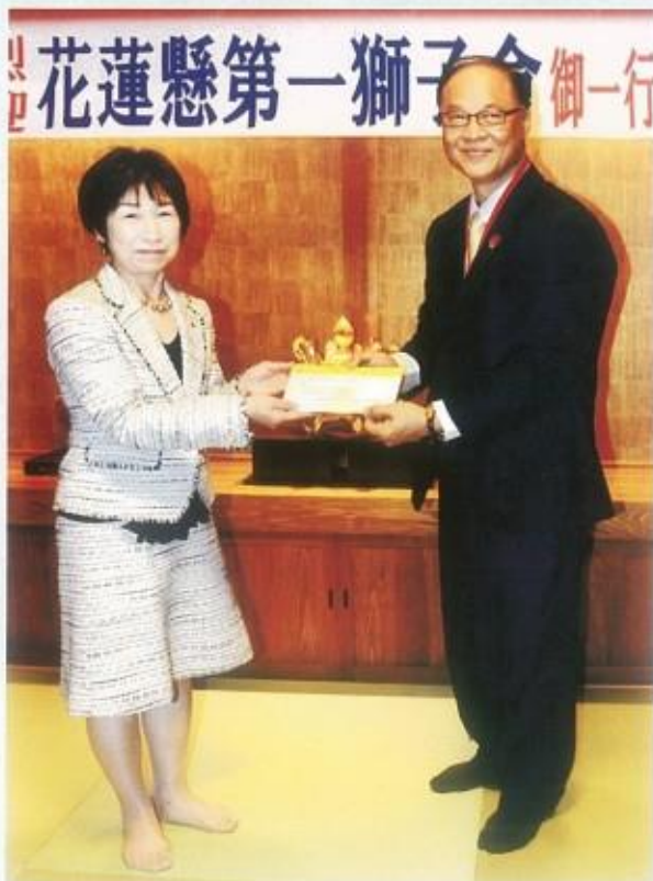
本會贈送荒尾獅子會 社會服務金日幣貳拾萬