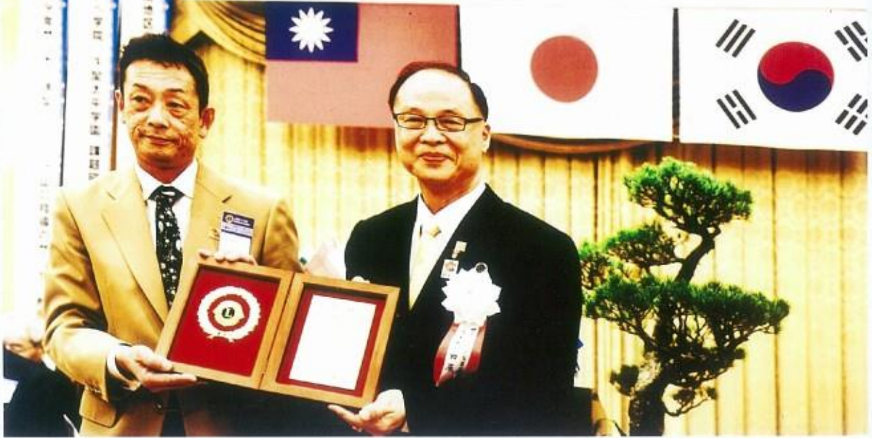
下関北ライオンズクラブ 50周年記念大会 前夜祭