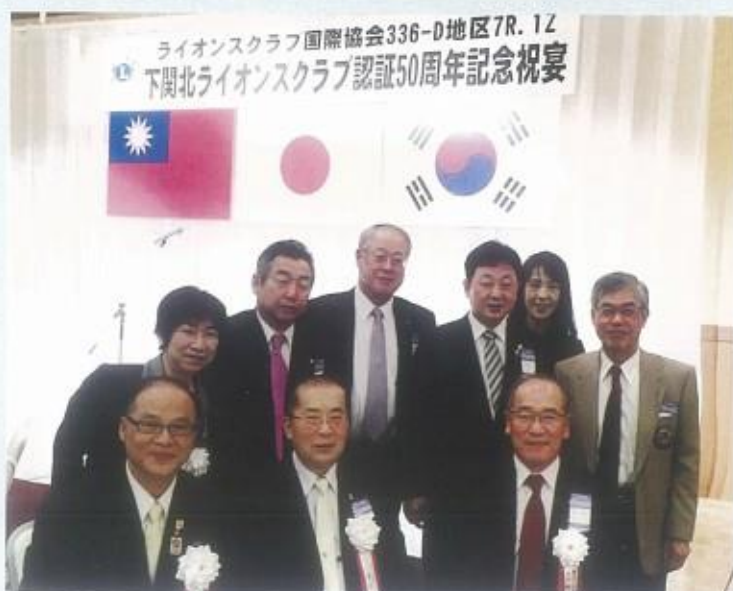
中日韓三國友會會長合影