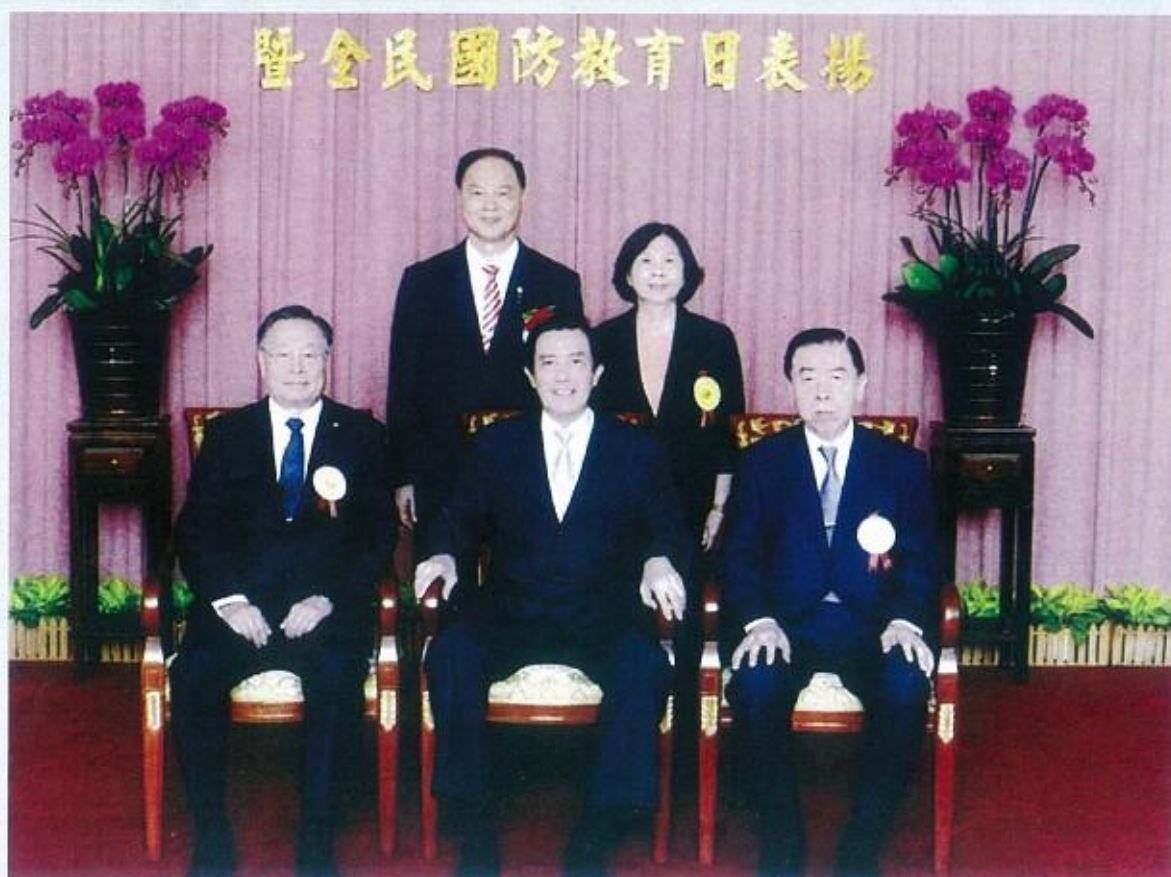
會長伉儷與馬總統、國防部嚴部長、軍友社李理事長