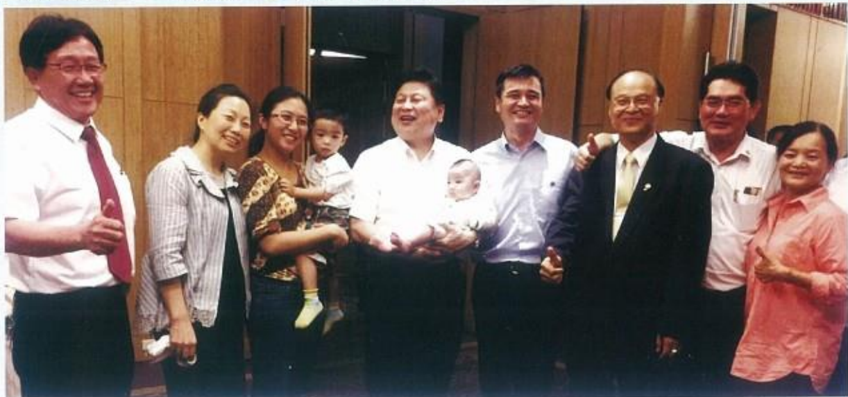
傅縣長參加本會例會 歡喜見