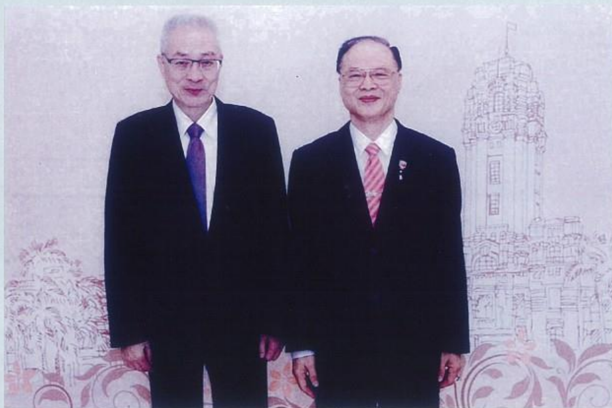
榮獲全國幼鐸獎-最佳貢獻獎接受吳副總統嘉勉表揚