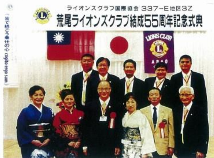
花蓮縣第一獅子會獅兄與荒尾姊妹會獅友在大會會場合影

以上謹供各友會參考，期勉對彼此會務上能有所裨益。愛鄉、愛國、愛社會是我們的信念，服務、和諧、圓融是我們的期許，民主、自由、和平則是我們的共同目標。