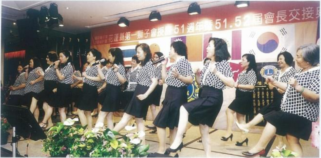
本會獅嫂上台獻唱