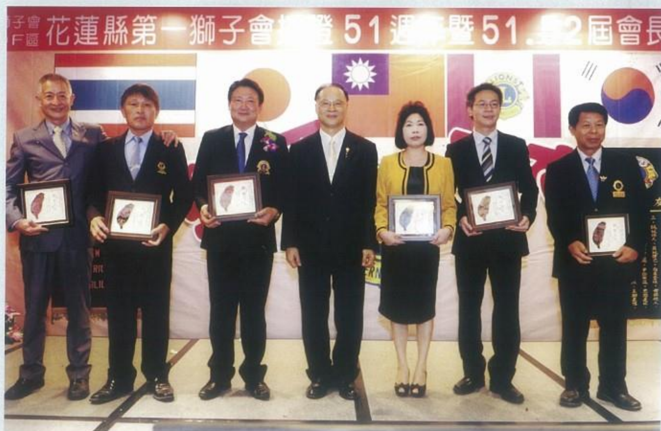
李會長致贈各兄弟會紀念品