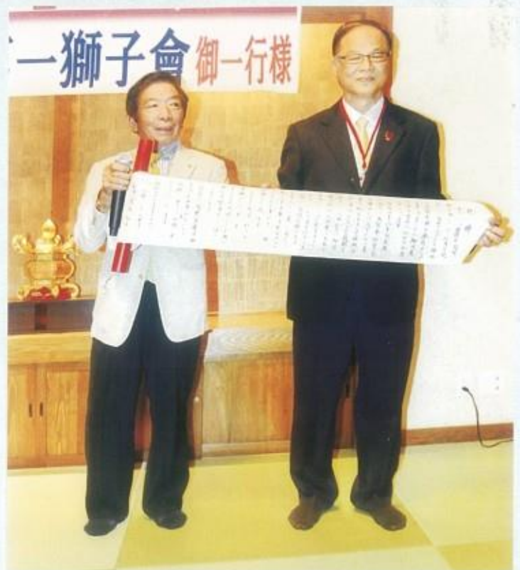
四十年前本會與荒尾姊妹會 締盟賀詞手卷