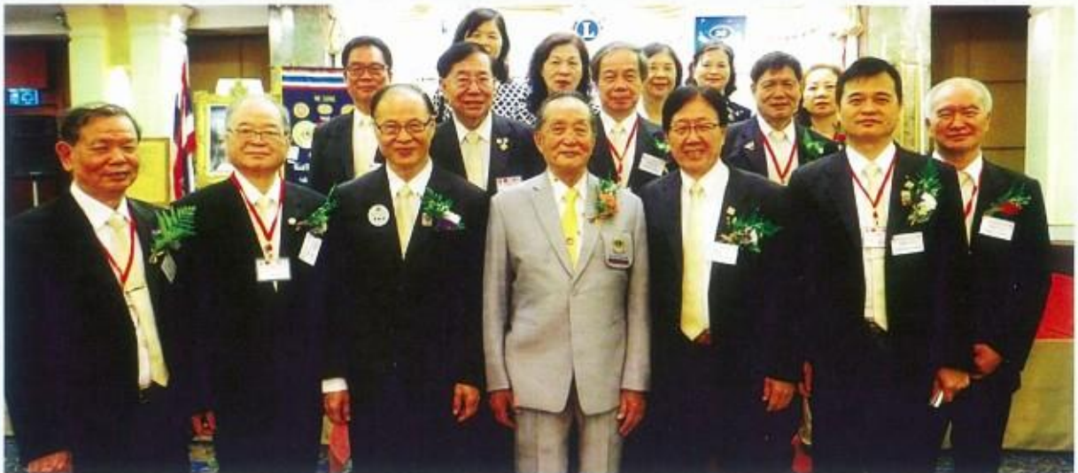
徐會長與本會獅兄合影