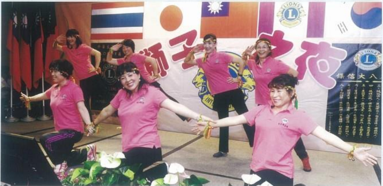
蓮花獅姊上台舞蹈