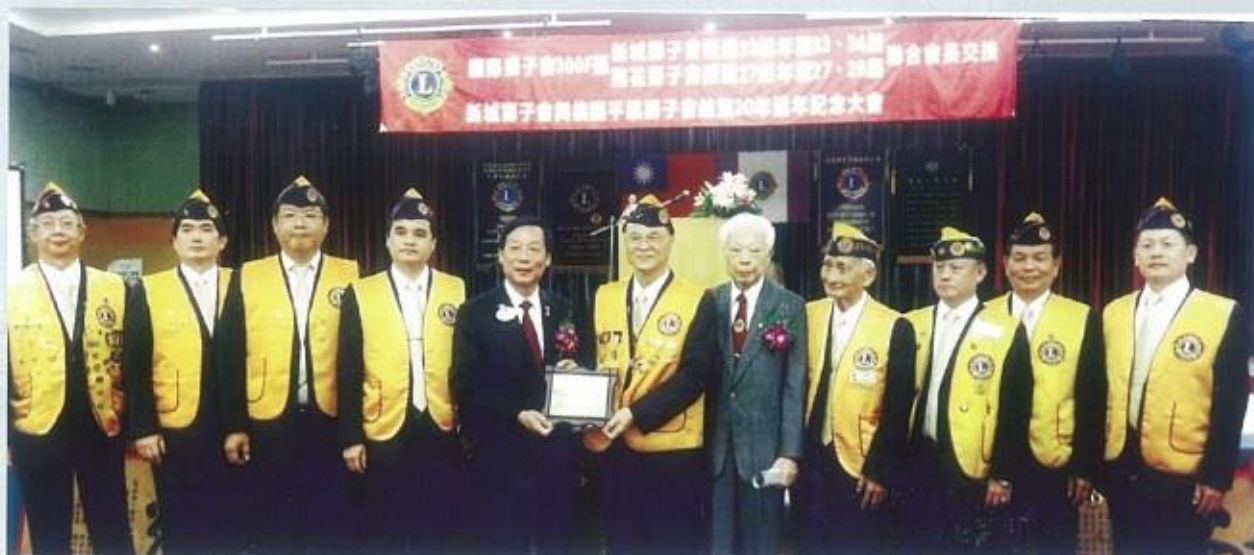
本會榮獲300F區和平海報第二名殊榮