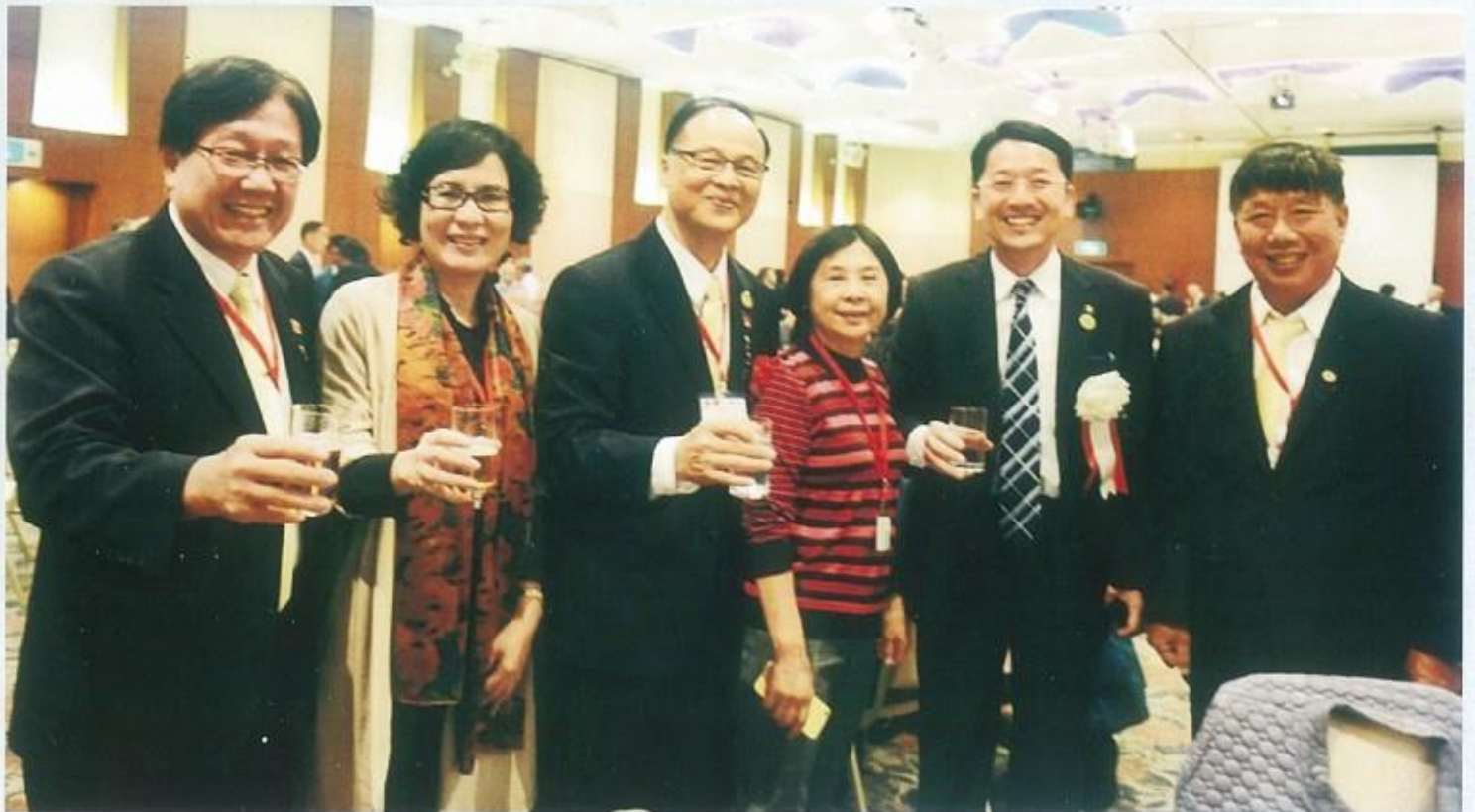
新舊任會長伉儷及方第三副總監與荒尾市長山下慶一郎合影