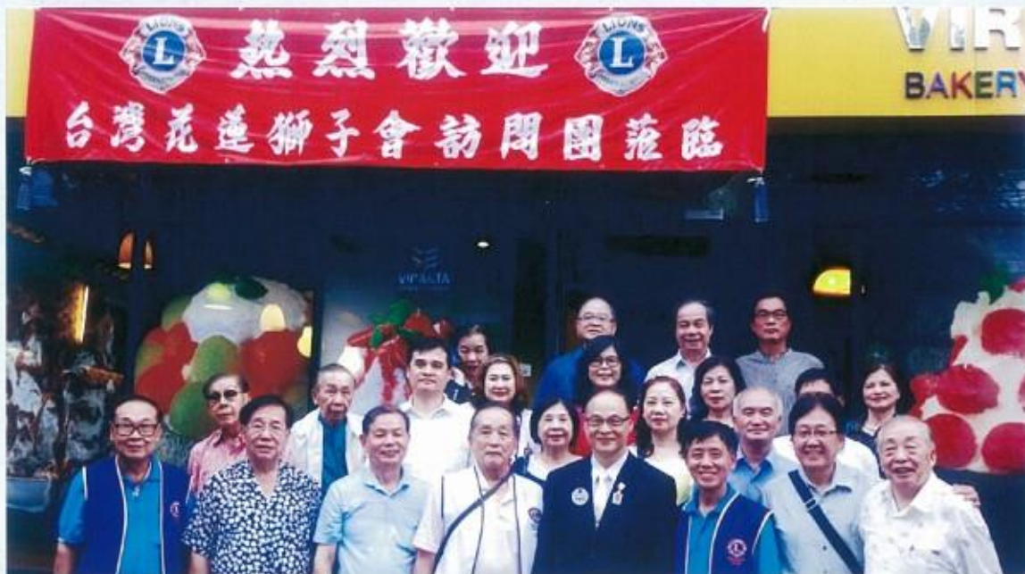
眾獅友於酒店前歡迎第一獅子會來訪