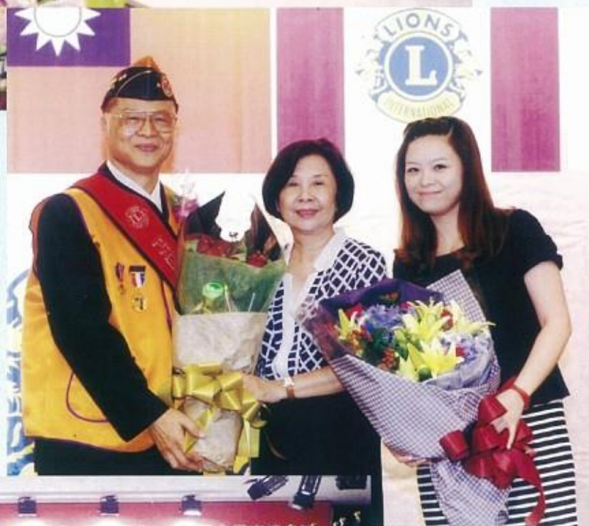
李會長全家福 上台獻上最高的祝福