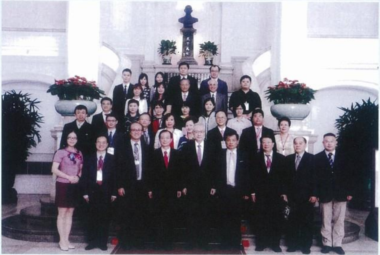
全體幼鐸獎受獎人與吳副總統合影