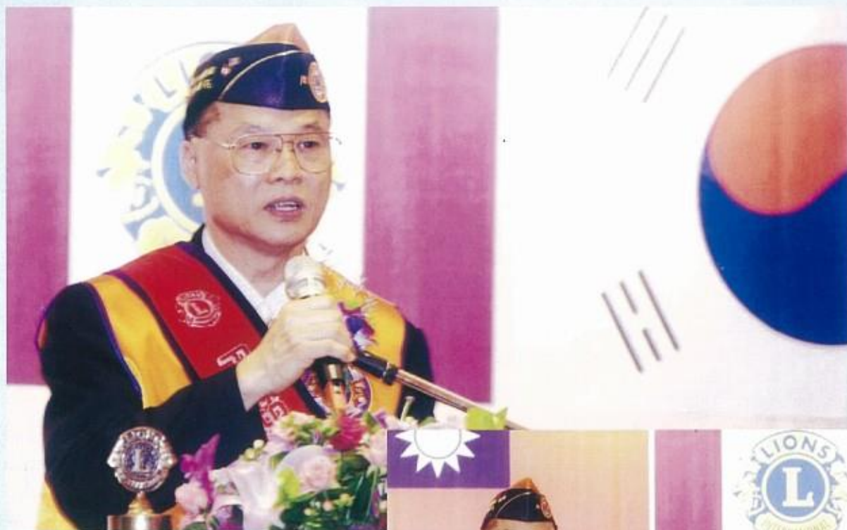
李會長曲原於大會上致詞