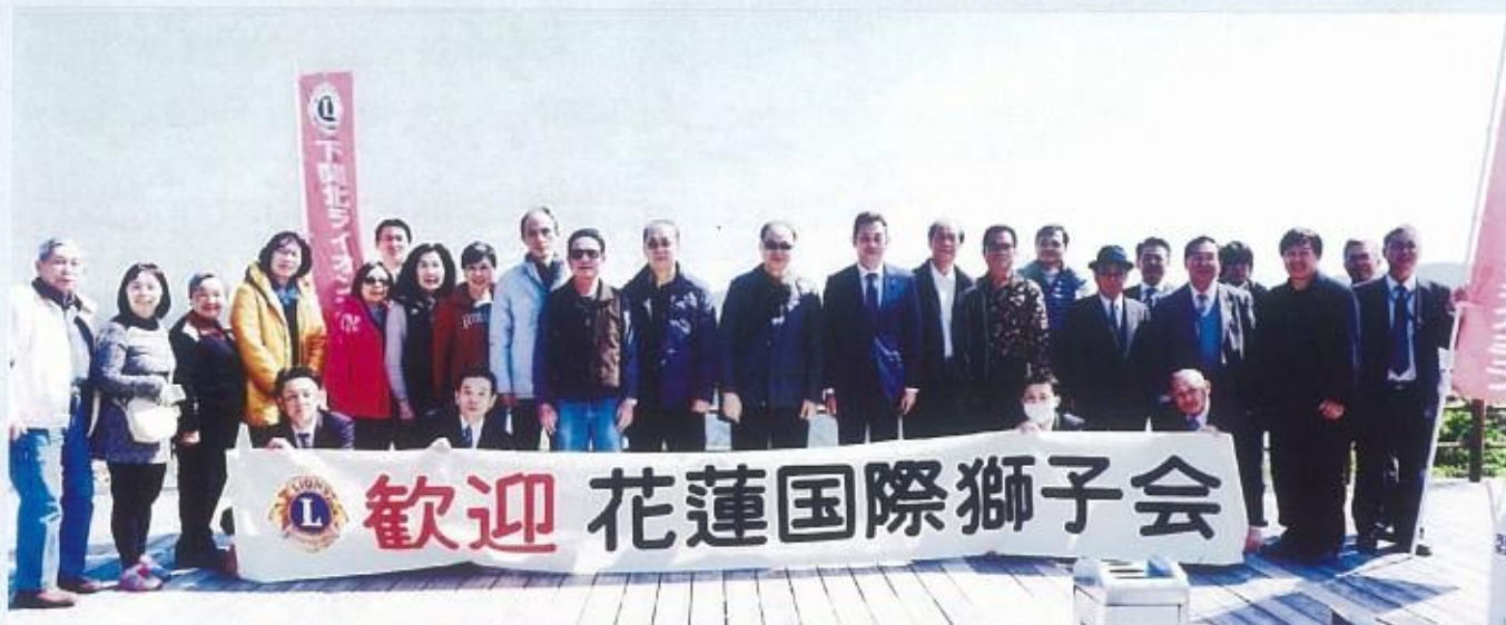
下關北獅子會在「火之山公園」歡迎本會來訪