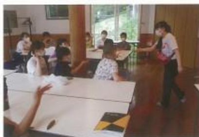
サポートプログラム