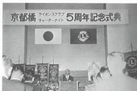
チャーターナイト5周年記念式典