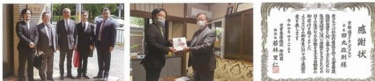
児童養護施設 迦陵園へ 車両寄贈