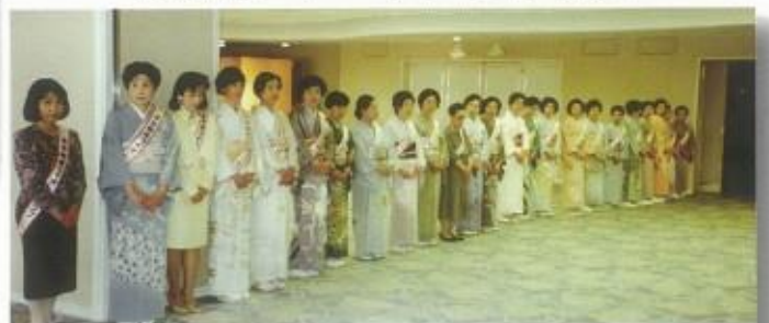
30周年記念例会でのお迎え