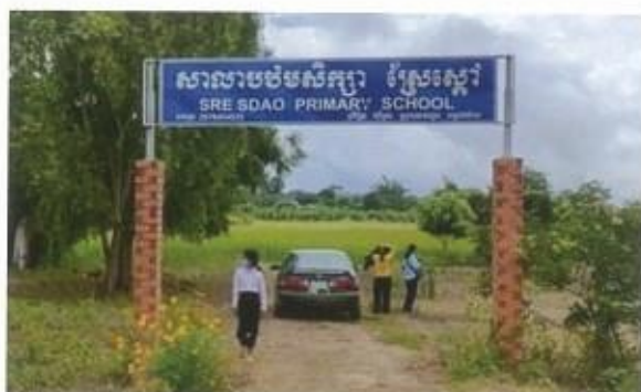
スラエ・スダウ小学校

スラエ・スダウ小学校では、同村の隣の2村からも子どもたちが通い、幼稚園の授業も始まることから、生徒数が増加しています。そのため、さらに3教室の校舎が必要となっております。