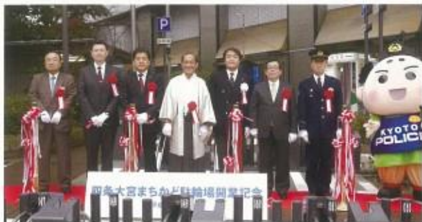
四条大宮駅周辺の駐輪場設備と整備の協力金