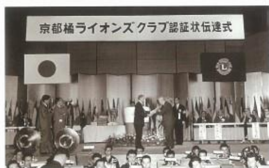
チャーターナイト認証状伝達式