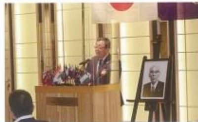
元ガバナーを称える月間例会