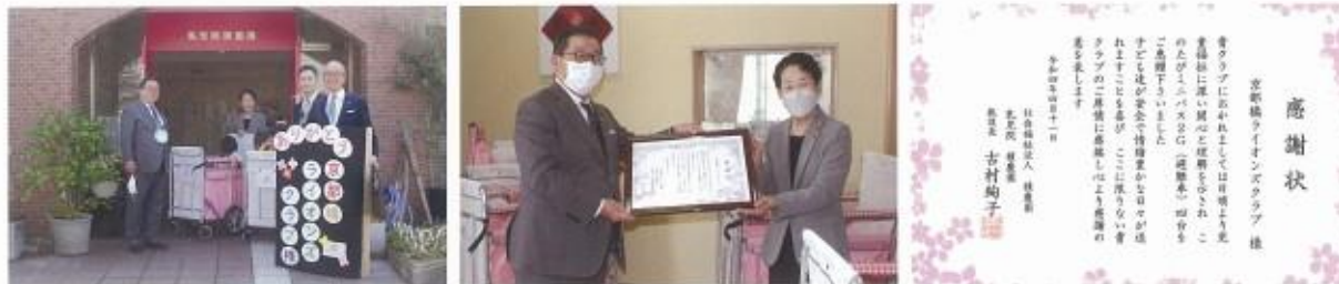
乳児院 積慶園へ お散歩バギー4台寄贈