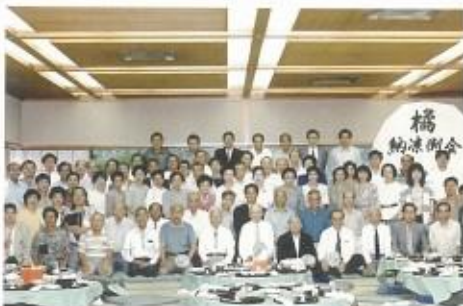
1991年7月23日納涼例会(嵐亭)