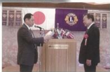
社会福祉法人 京都ライトハウスへ車いす仕様自動車、点字プリンタ、CDコピー機を寄贈