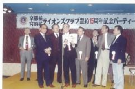
京都橋ライオンズクラブ・宮崎橋ライオンズクラブ 盟約15周年記念パーティー