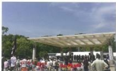
東日本大震災・熊本大地震復興支援チャリティフェスティバル「タチバナフェス」開催