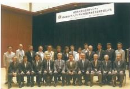
東日本大震災復興チャリティ横山幸雄ピアノリサイタル 「鎮魂と再生を祈る桜を植えよう」開催