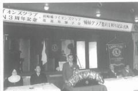
チャーターナイト3周年 姉妹クラブ盟約1周年記念式典