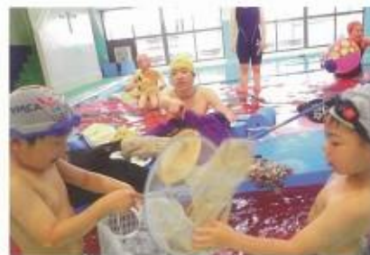
スイミング(障がい児スイミング)