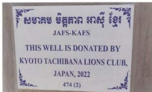
井戸につけられたネームプレート