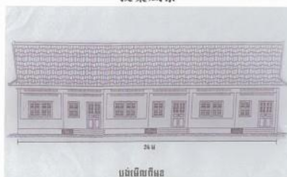
教室建築計画図面