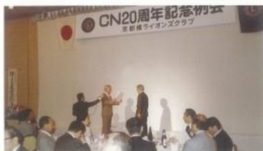
チャーターナイト20周年記念例会