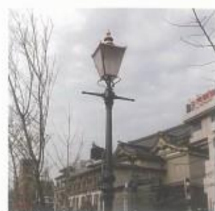
鴨川左岸環境整備事業としてガス灯設置