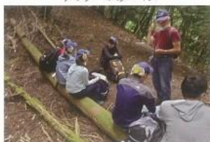
リーダートレーニング