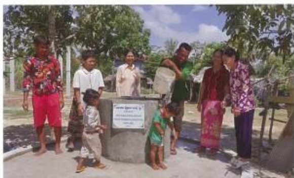
村で安全な水が使えることは大きな喜びです