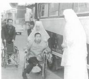
聖ヨゼフ整肢園への車椅子寄贈