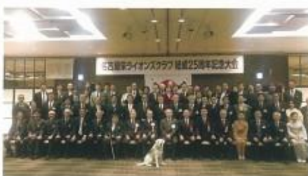
名古屋栄ライオンズクラブ結成25周年記念大会訪問