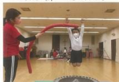
体操教室(ユーススポーツプログラム)