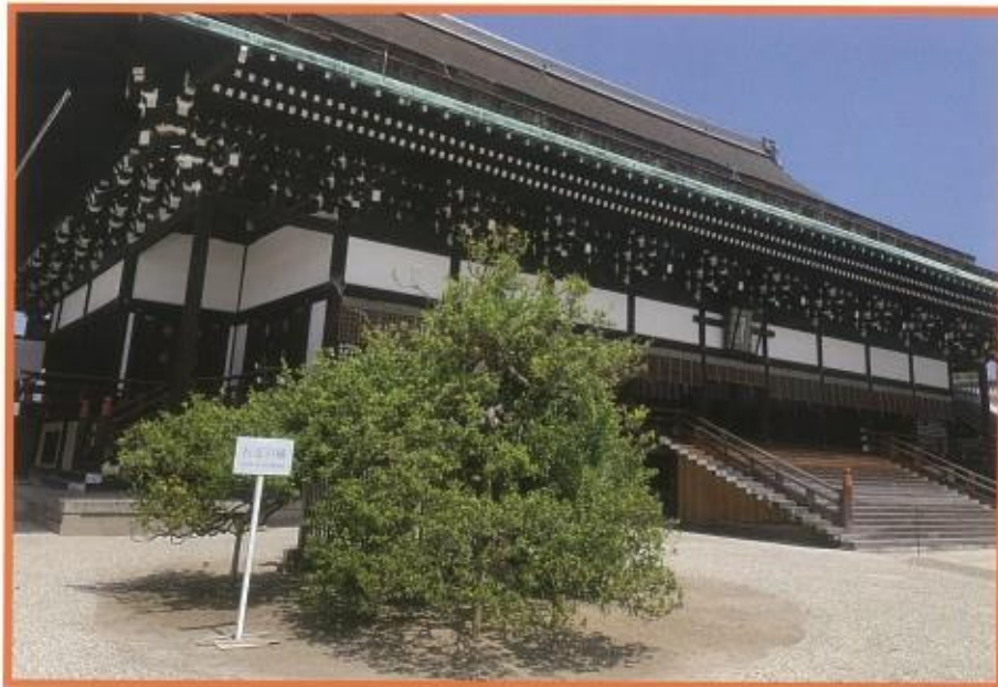
京都御所 紫宸殿 右近の橘

「橘花は実さへ花さへその葉さへ 枝に霜降れど弥常葉の木」 — 万葉の古歌より —