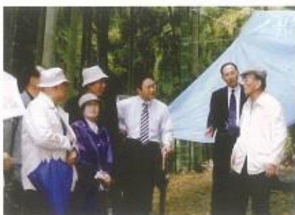
04年4月27日L中原のお山で笛振り