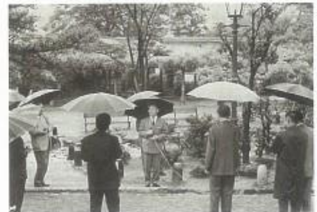
京都府・市へガス灯2基