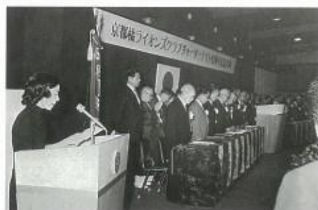
チャーターナイト10周年記念式典