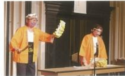
オークション例会 バナナの叩き売り