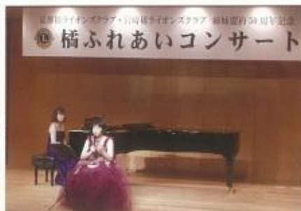
姉妹盟約50周年記念 ふれあいコンサートを開催