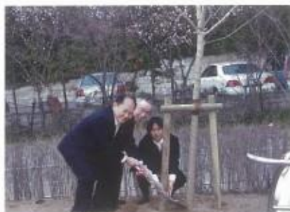
姉妹盟約40周年記念で宮崎橋 LC と合同で高台寺公園に植樹他