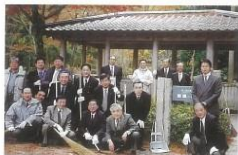
宝ヶ池公園野鳥の森四阿清掃活動