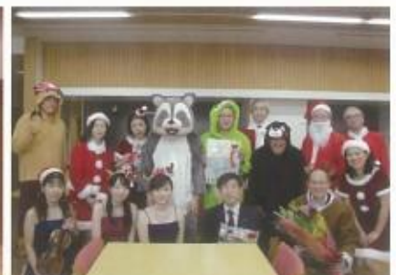
京都市立北総合支援学校にて 第3回橘音楽祭を開催