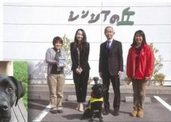
社会福祉法人 日本介助犬協会へ繁殖犬購入の協力金