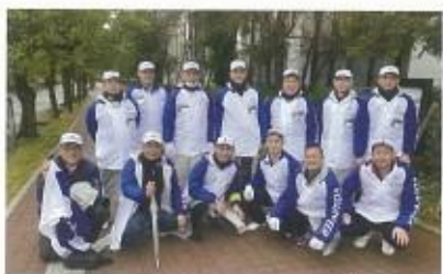
京都マラソン 2020 沿道整理