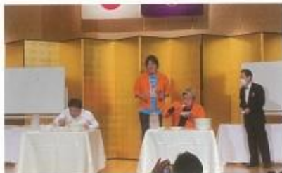
月見例会 フードファイト