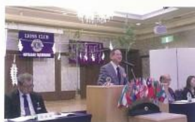
宮崎橋ライオンズクラブ訪問