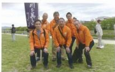
鴨川クリーンハイク参加