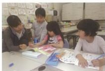
アフタースクール