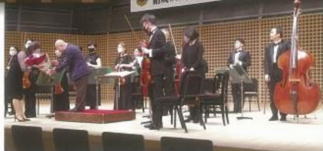
結成60周年記念チャリティーコンサート