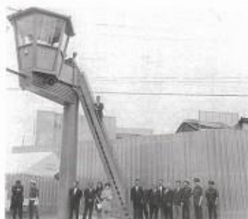
京都府警へ交通整理塔1基寄贈