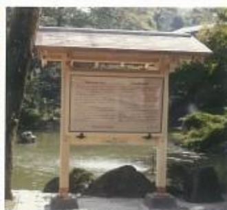
円山公園由来板設置