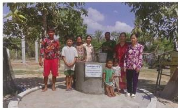
井戸がない時は遠くの池まで水を汲みに行かなければなりませんでした