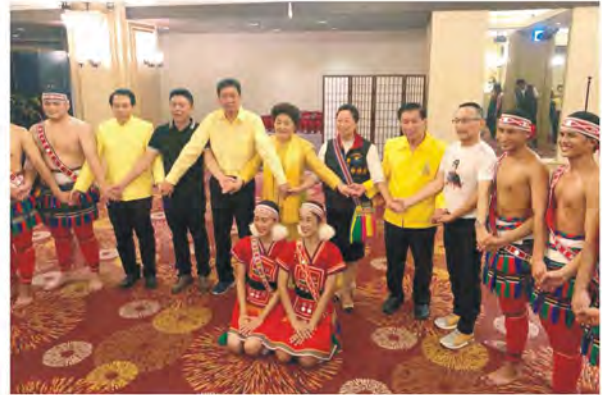
大家來跳舞，貴賓與花蓮縣長徐榛蔚合影

108年9月23日，花蓮第一獅子會與泰國曼谷德威瓦他拿獅子會在百餘位貴賓、獅友見證下，於花蓮市翰品酒店簽訂國際友好會備忘錄，本次雙方能締結友好關係，歸功於花蓮縣政府的大力促成牽線，徐榛蔚縣長亦蒞臨現場祝賀，期許兩國持續拓展國際交流，增進友好關係。