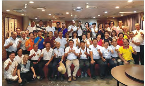
中午與台中港獅子會獅友聚餐