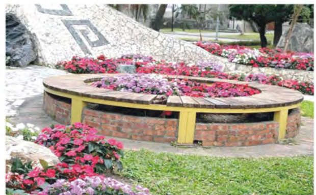
在2020年農曆春節已是滿園花團錦簇美不勝收，是花蓮市區唯一打卡景點