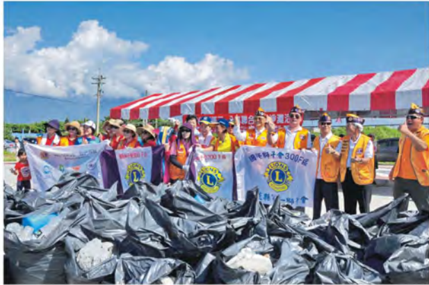
環保淨灘活動成果之一