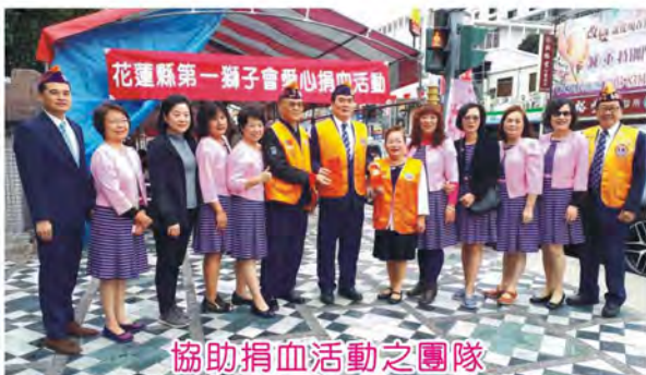
協助捐血活動之團隊

會長表示感謝全體獅友、獅嫂的支持與付出，使捐血活動圓滿結束，共募得鮮血1244袋也創本會捐血新高點。得力於本會全體獅友團結合作提供摸彩品約100件，縣長徐榛蔚捐贈兩台單車抽獎助興。本會為響應捐血月原預算只有5萬元，基於獅友的榮譽感反應熱烈募得善款9萬4千元，使捐血活動順利推展完成「服務社會 造福人群」義舉獅子會崇高理想永傳承。