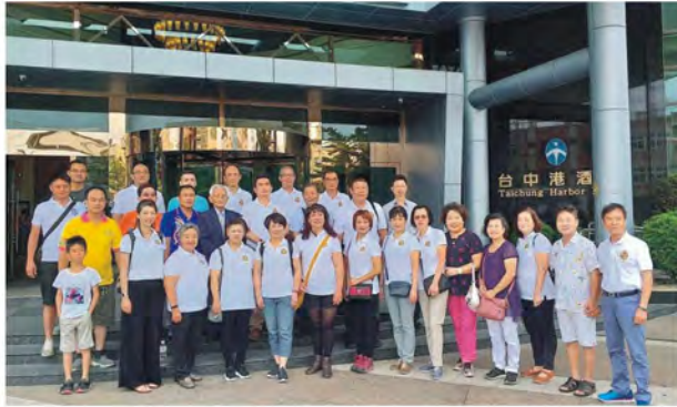
自強活動二日遊出發前合影