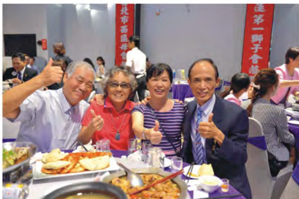
參加台中港授證獅友聯歡留影