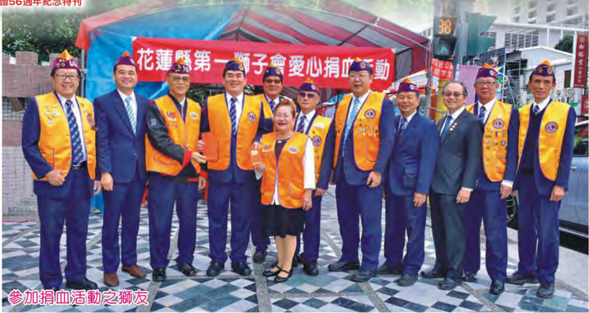
參加捐血活動之獅友