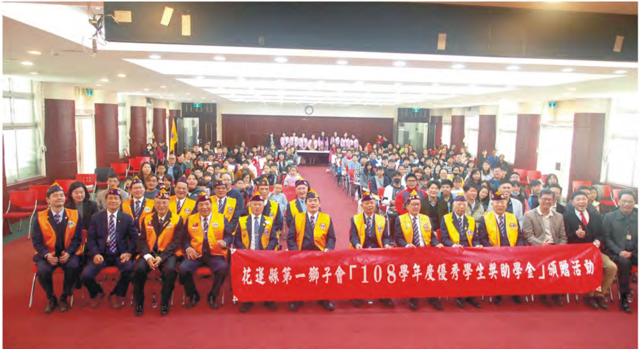
108年度優秀學生獎助學金頒獎典禮