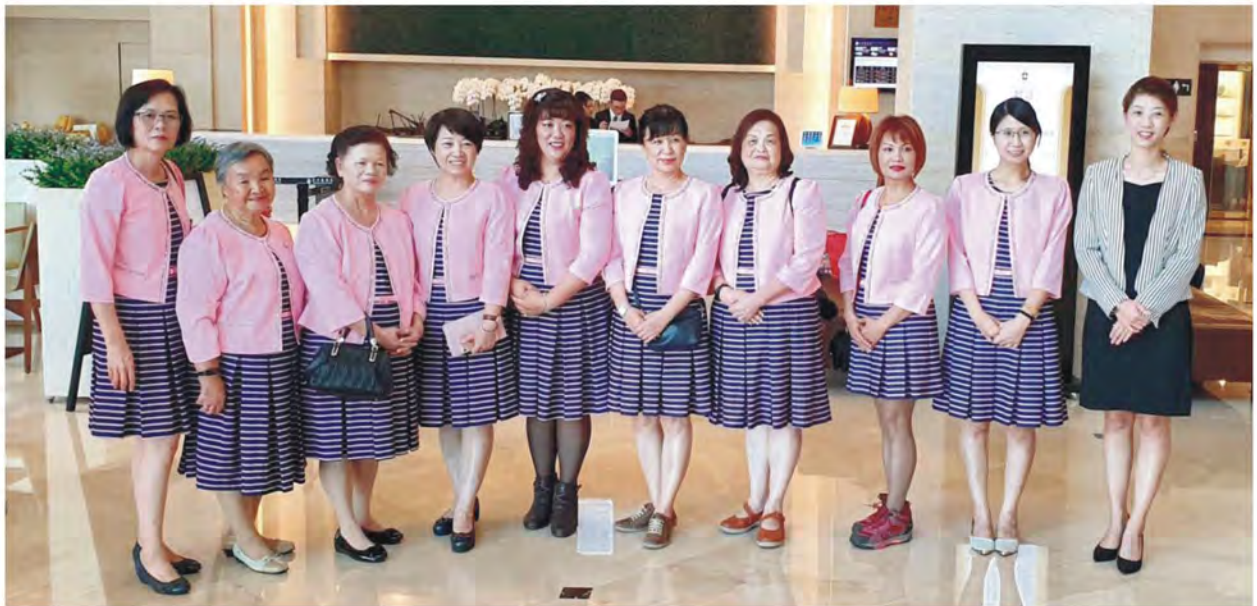
參與台中港獅子會紀念慶典獅嫂合影