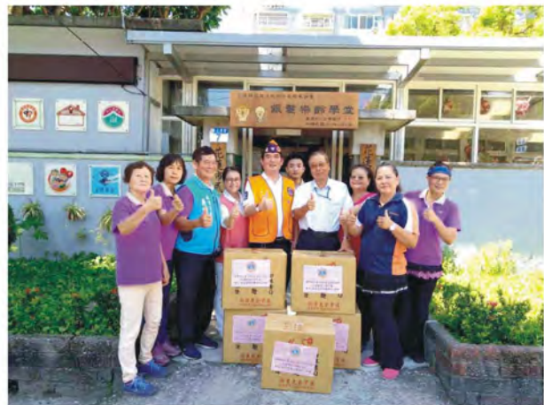
本會捐贈生活用民生物資給予銀髮樂齡學堂學員