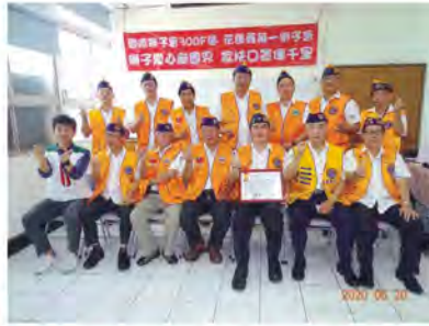
與會獅兄與施主任合影