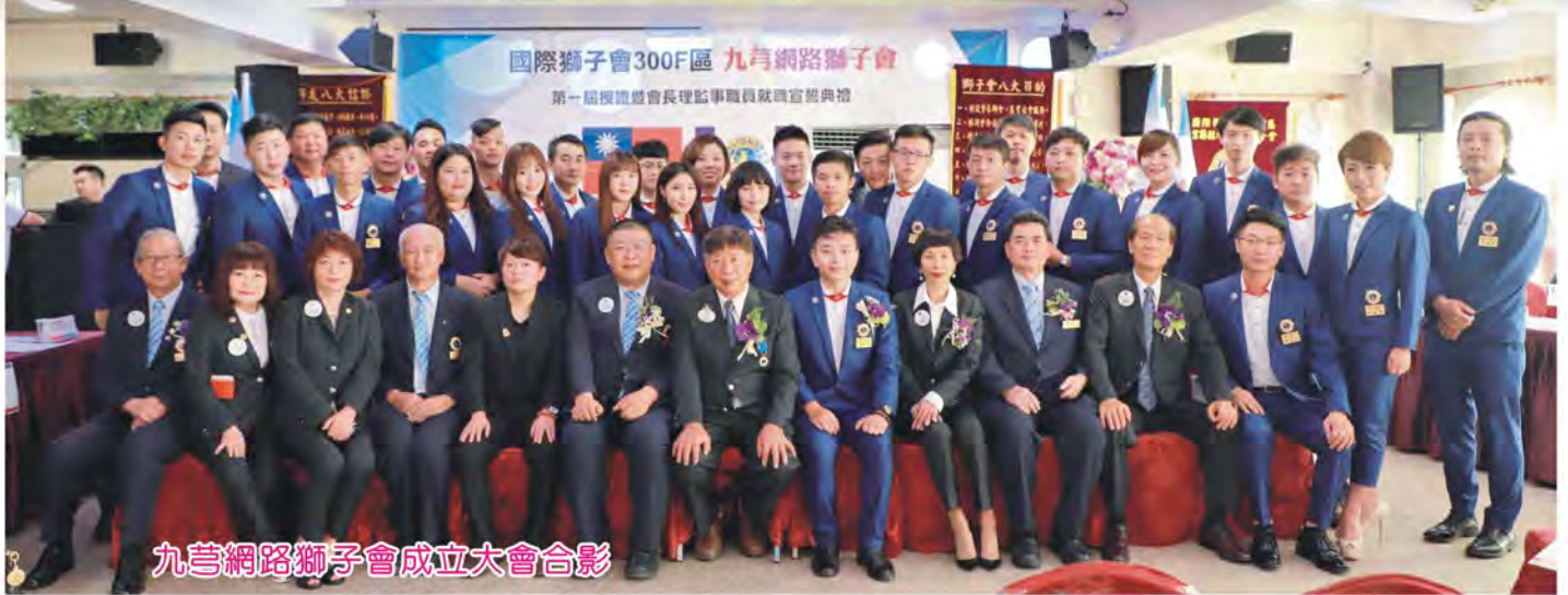
九芎網路獅子會成立大會合影