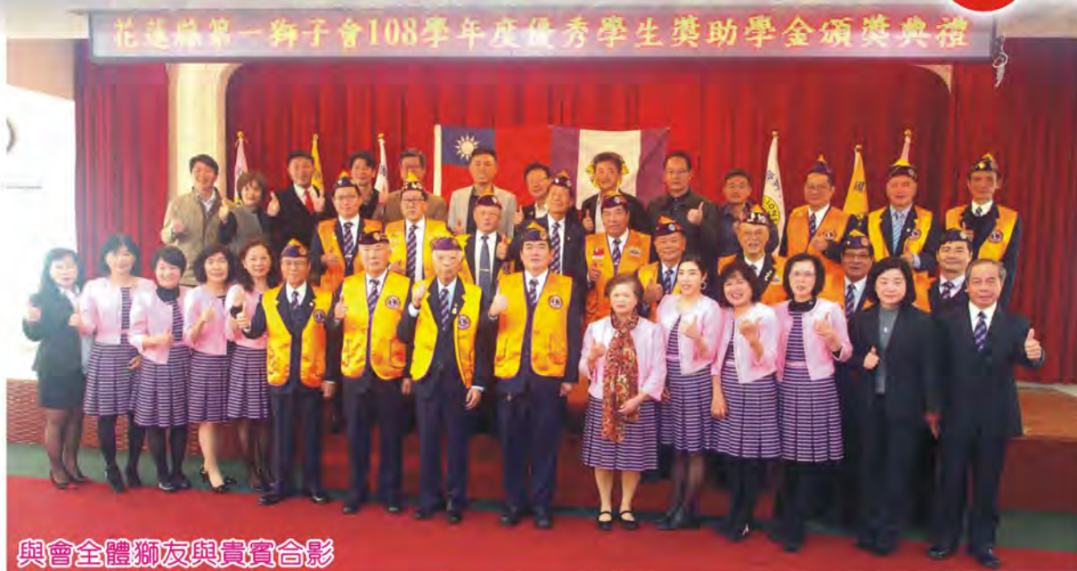
與會全體獅友與貴賓合影