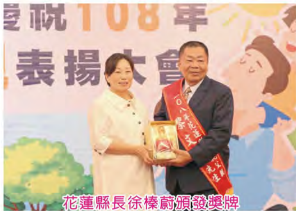
花蓮縣長徐榛蔚頒發獎牌