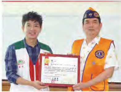
施主任致贈感謝狀