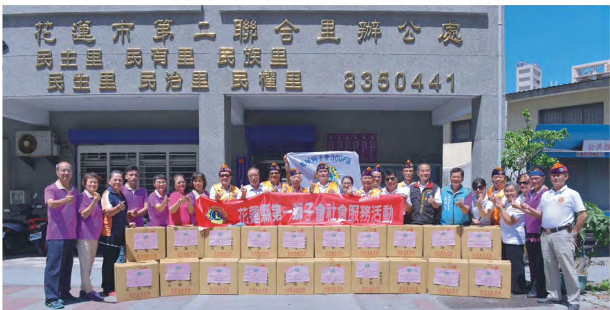
捐贈「民生物資」予花蓮醫院社工室長期照護站合影