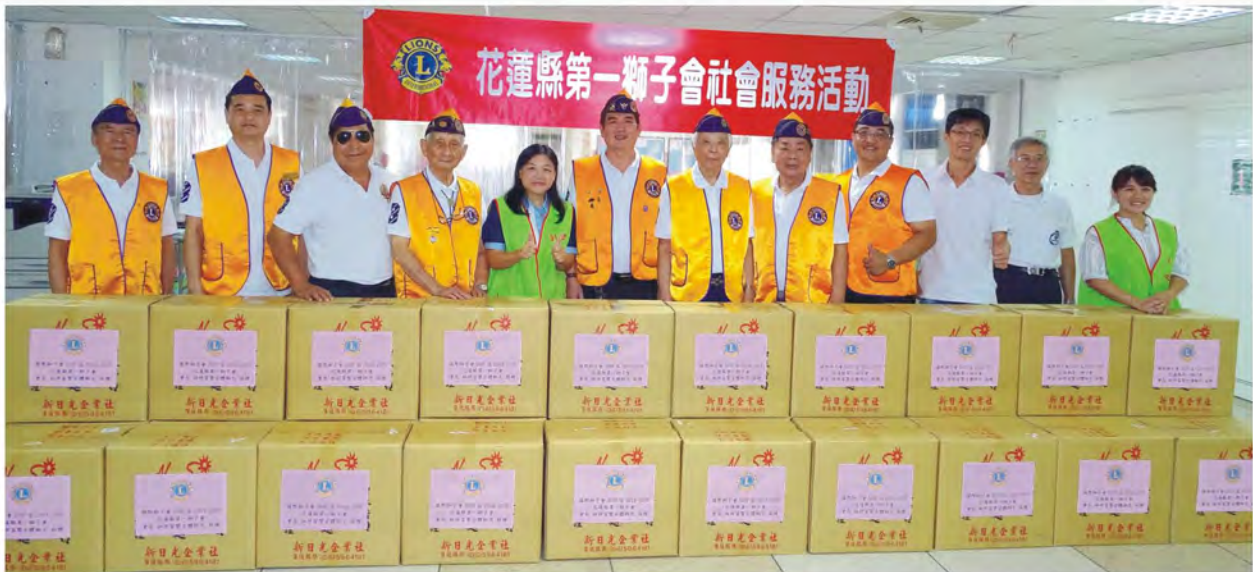
參與活動全體獅友合影留念