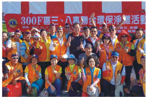
獅友們大家一起來淨灘吧！