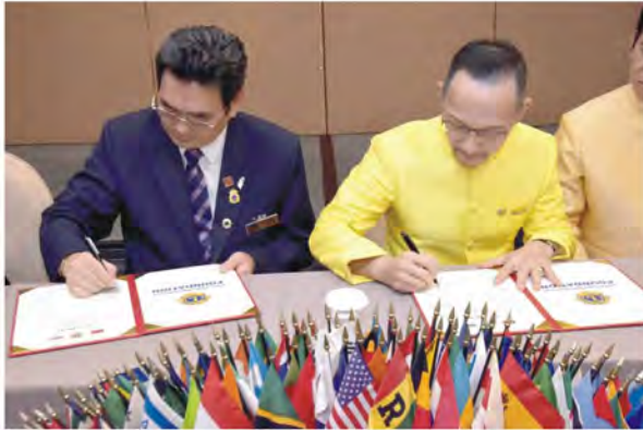
兩會會長簽訂國際友好會備忘錄