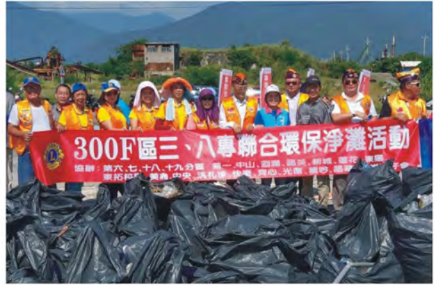
環保淨灘活動成果之二