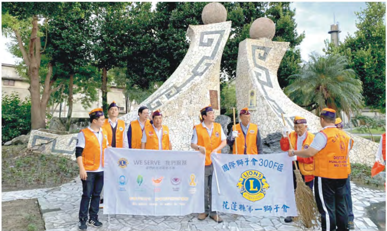
大夥兒打掃整理工作完成後合影