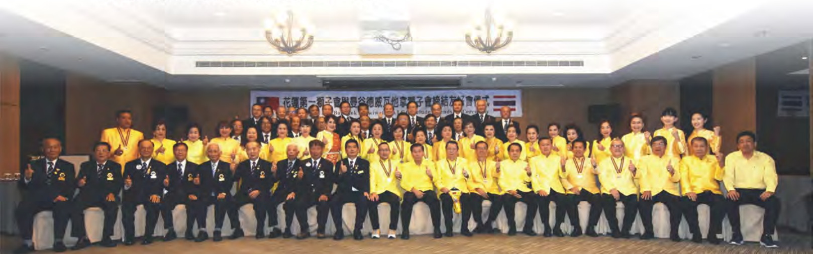
本會與曼谷德威瓦他拿獅子會合影

花蓮縣第一獅子會與泰國曼谷德威瓦他拿獅子會簽訂友好備忘錄後，兩會將共同致力推動兩國間之國民外交，期許增進兩國民間友好，促進互訪、互助以增進獅誼，共同為發揚獅子會「服務社會，造福人群」崇高理想而努力。