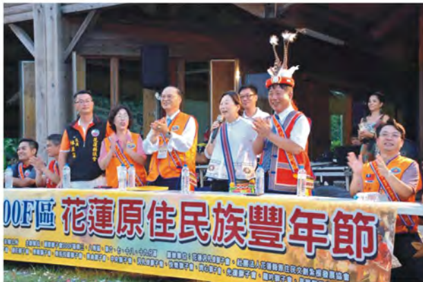
花蓮原住民族豐年節-縣長徐榛蔚致詞