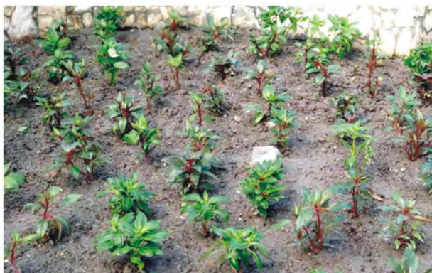
2019年11月21日在本會獅子會百年紀念公園種下900株新種大花鳳仙花成長良好