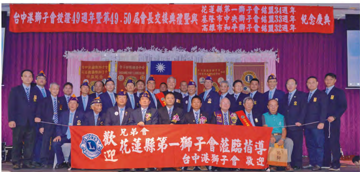
台中港獅子會授證49週年暨會長交接典禮與本會結盟34週年紀念慶典