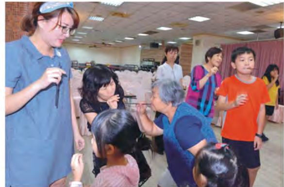
中秋聯歡晚會趣味競賽