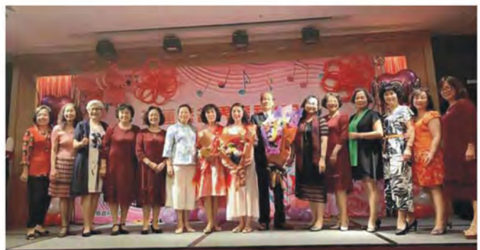
頒獎後與全體交流協會會員合影