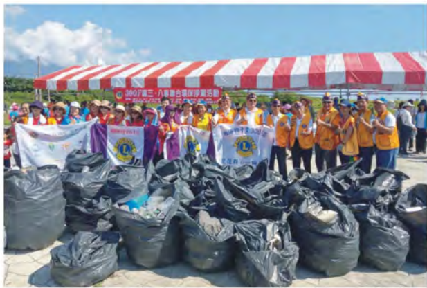
環保淨灘活動成果之三