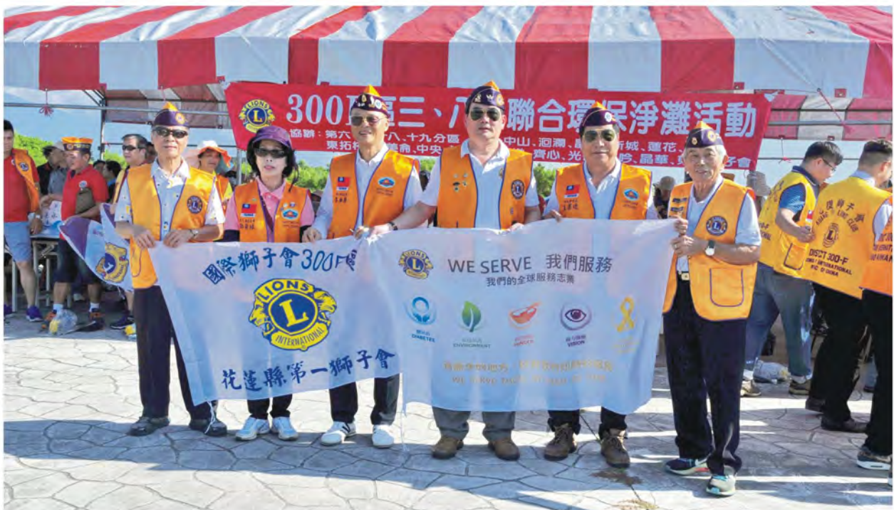
第三、八專區聯合環保淨灘活動全台動員